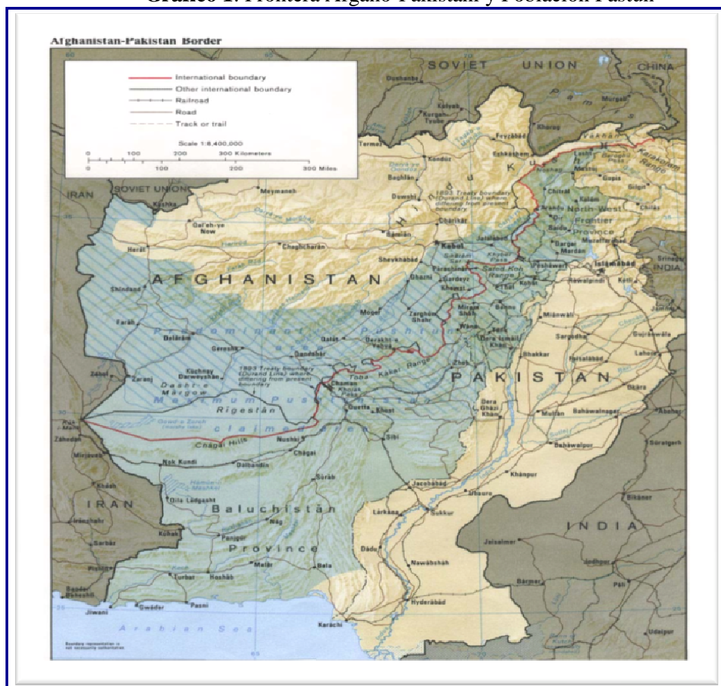
Gráfico 1: Frontera Afgano-Pakistaní y Población Pastún