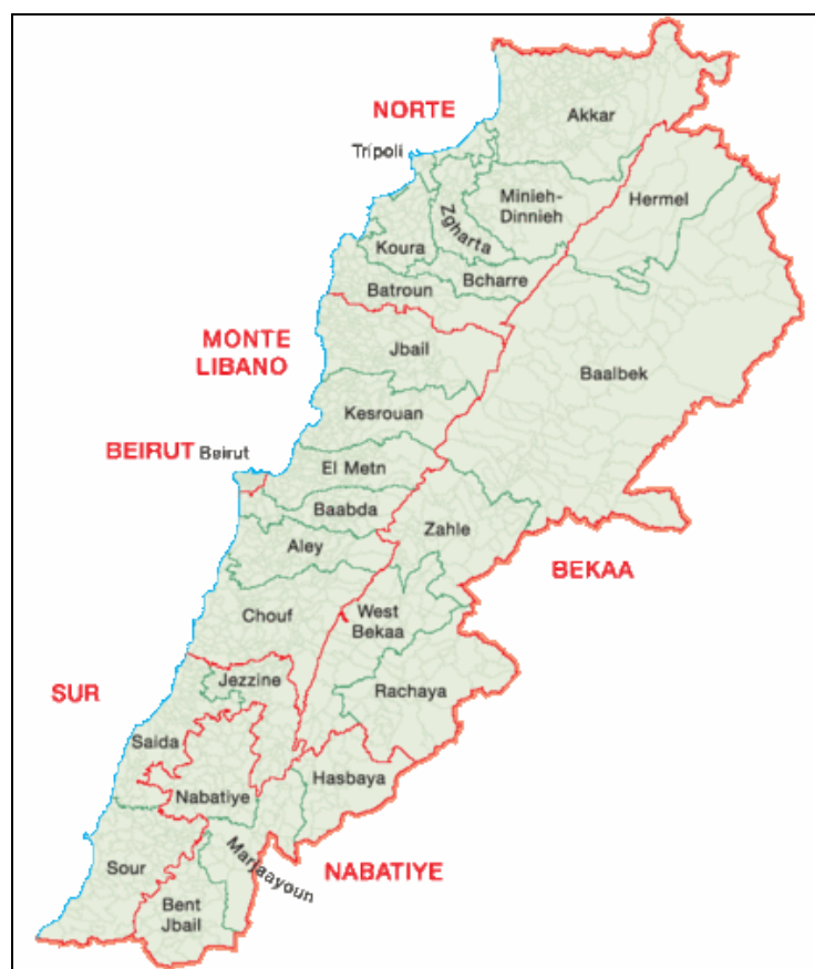
Fig. 1: Mapa del Líbano 5

El Líbano ( Al-Jumhuriya-al-Lubnaniya ) es un reflejo, en escala reducida, del crisol de razas, culturas y religiones que representa del Próximo Oriente. Este diminuto Estado (10.400 Km cuadrados) 3 es el más pequeño de todo el Próximo Oriente. Su tamaño es similar a Asturias pero en el viven chiítas, suníes, drusos, cristianos maronitas, armenios, griegos etc... bien escribe uno de los mayores expertos sobre el Líbano que hay en España, “ su composición demográfica es a la vez una bendición y una desgracia ” 4