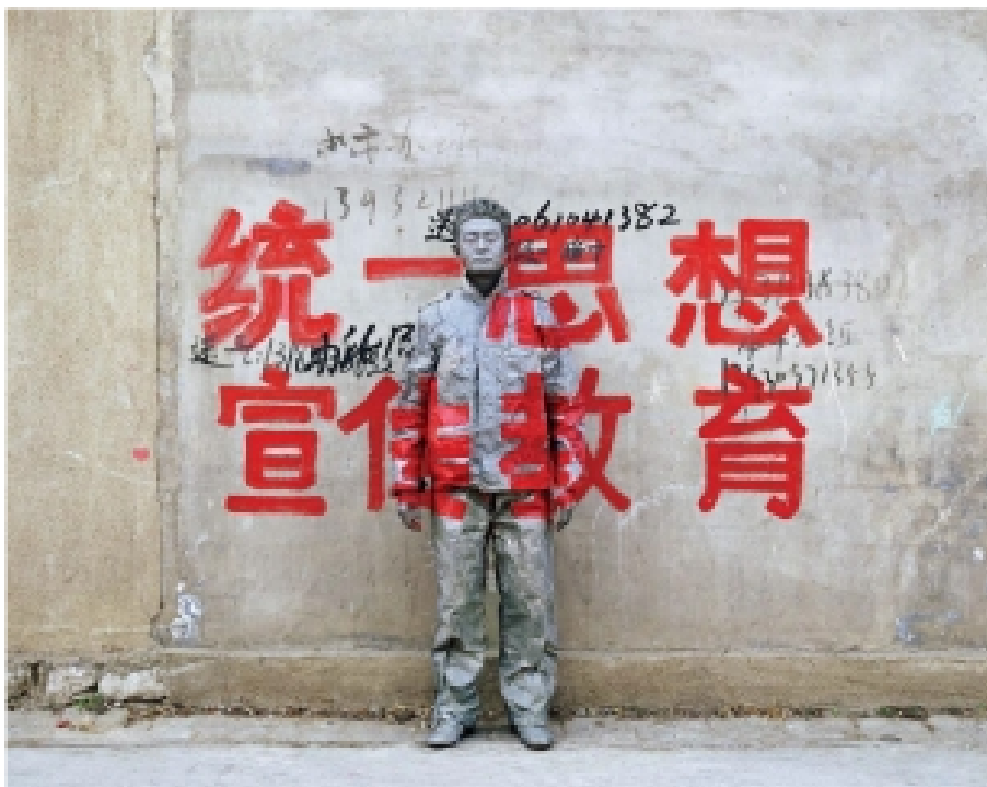
IMAGEN 1. LIU BOLIN ART STUDIO, PICTURE