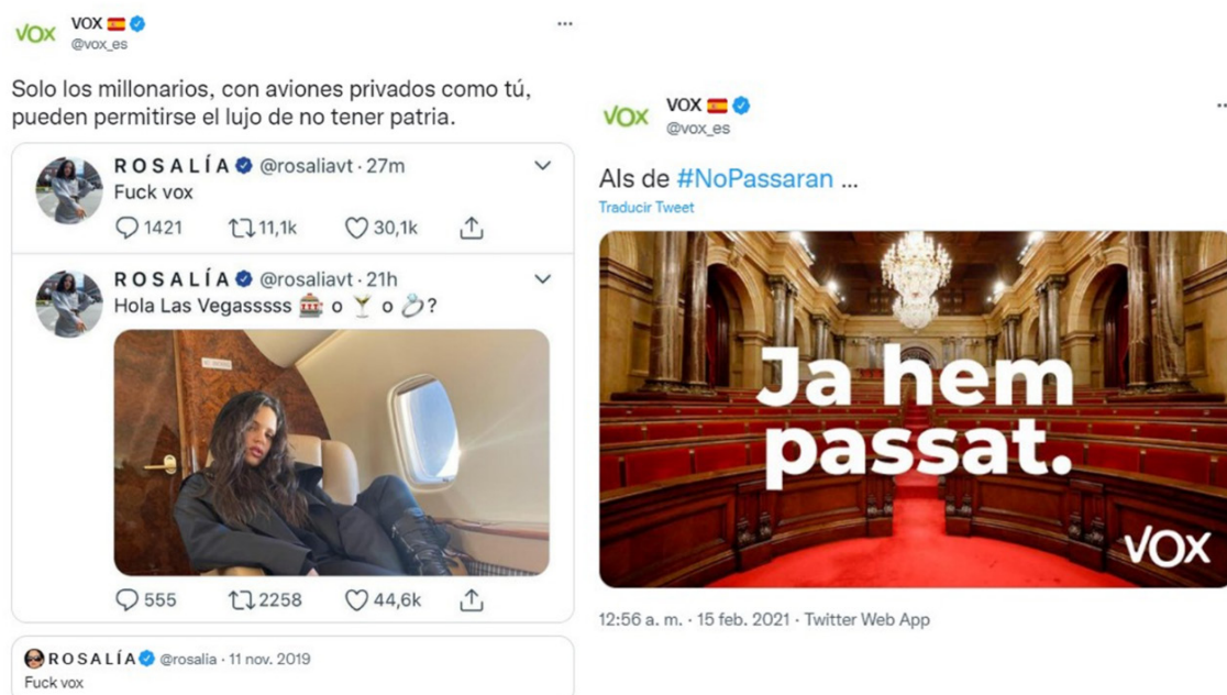
Figura 4. Los ‘zascas’ de Vox.

El meme es una victoria simbólica que actúa de mnemotécnica para construir una memoria de las grandes gestas electorales mediante la ‘experiencia oral secundaria’ (Ong, 1996) de los zascas. Estas capturas de pantalla muestran una memoria construida a través de victorias de Vox a los enemigos de la patria, a saber, las élites woke (representadas por Rosalía) y el antifascismo. El meme conecta en un ejercicio de comunión las grandes victorias institucionales del partido con las pequeñas victorias de los zascas perpetrados no solo por el partido, sino por todos sus seguidores. En la caseta de los memes, también se pueden observar los retuits que la cuenta oficial de Vox hacía de zascas a cargo de