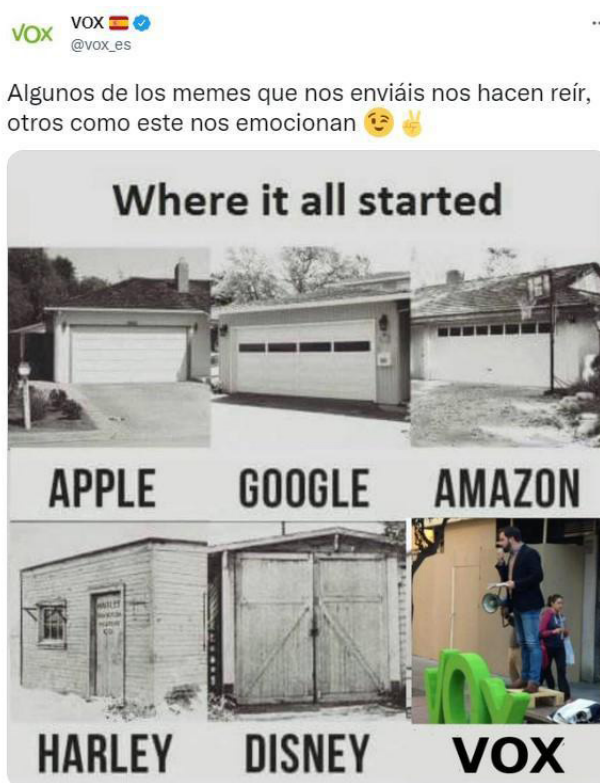
Figura 2. Meme sobre los inicios de Vox.

Este meme crea un hito en la narrativa de Vox, contribuyendo en la memoria colectiva y la auto-mitificación (Marrs y Dingsun, 2021) del líder y la organización. A través de su vinculación con cinco empresas estadounidenses —cuyos mitos fundacionales narran el trabajo individual, humilde, valiente y outsider de sus fundadores en un garaje—, este meme construye una 'tradición inventada' (Hobsbawn y Ranger, 2002) de sus inicios. El meme inserta el lore de Vox en uno más amplio: el del sueño americano, la cultura del emprendimiento o las start-ups que lograron imponer su modelo de negocio, cambiando las reglas en el mundo de la empresa. De esta manera, el meme se inscribe en una narrativa de 'realismo capitalista' (Fisher, 2016), donde además de adscribirse el capitalismo como único sistema económico-político posible, se produce una 'precorporización' de todas las acciones públicas, quedando todo a merced de sus lógicas y, por lo tanto, demostrando que la historia de éxito de un partido solo puede llevarse a cabo mediante la reproducción de la cultura del emprendimiento.