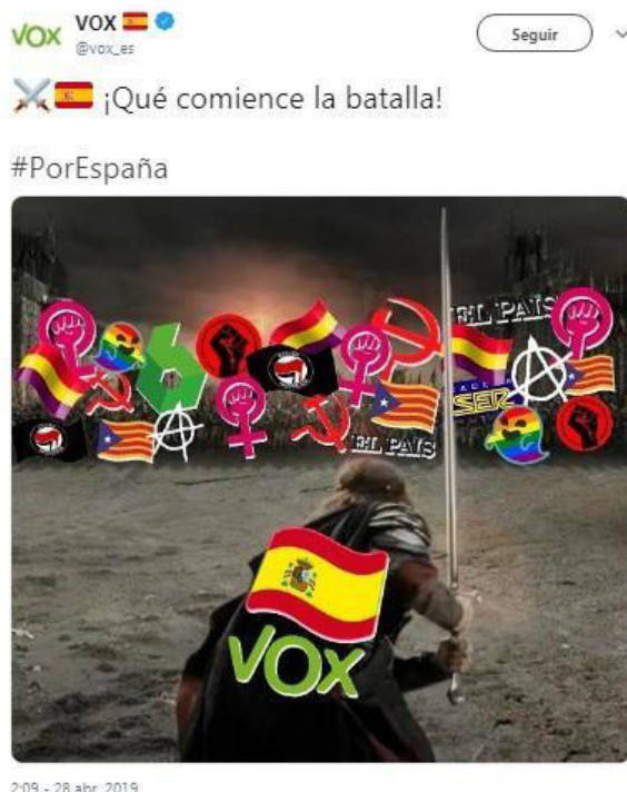
Figura 3. Meme de Aragorn y Vox.

Con este meme, una publicación amateur y low-effort que utiliza la plantilla de la carga de Aragorn en El señor de los anillos: El retorno del rey (2003, Peter Jackson), Vox consiguió atraer la atención de los medios tradicionales. Warner, la productora de la película, también reaccionó a su publicación, saliendo a desmentir que hubiese autorizado el uso de sus imágenes para la difusión