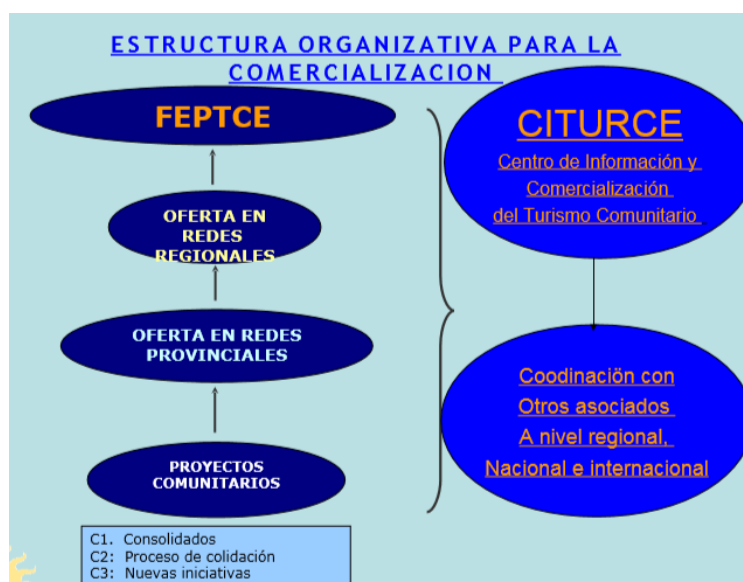
Imagen 2. Estructura Organizativa de FEPTCE para la comercialización.

Tanto en la imagen 1 como en la imagen 2 se puede evidenciar la poca especialización en los puestos, la reducción de las diversas formas de diferenciación localizadas entre la cumbre estratégica y el resto de la organización, es más, quienes se encuentran en la cumbre estratégica de FEPTCE son las 106 comunidades distribuidas representadas bajo la figura de Asamblea General; seguido del Consejo directivo, Presidente y las áreas de Administración y Técnica. Con respecto a la especialización de los puestos en la estructura organizativa de FEPTCE, se tratan de trabajos sencillos y rutinarios que exige una especialización mínima en cuanto al trabajo pero con gran control sobre las tareas realizadas. Las unidades de trabajo de FEPTCE son pequeñas pero con un marcado contacto personal con los miembros de las comunidades participantes. Finalmente, FEPTCE logra la coordinación por medio de la normalización de las reglas, según la cual la coordinación se consigue porque comparten los valores y creencias entre sus miembros.