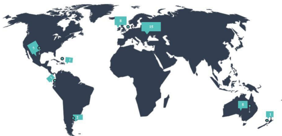
Figura 2. Artículos por región.