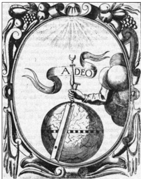
6. Saavedra Fajardo, Empresas políticas , Empresa 18 A deo.

formal notable de ambas composiciones 19 . Concluye González de Zárate que Velázquez quiso significar la necesidad de educar al príncipe conforme a la razón y, basándose en los emblemas de Alciato, Mariana y Covarrubias, así como en las tesis de Moffit y Liedtke, interpreta el caballo como alegoría del pueblo o muchedumbre que debe ser sujetado 20 . En ese mismo sentido utiliza Saavedra la imagen del caballo en la empresa 38, así como en la 21 que, bajo el título de regit et corregit , presenta un freno y unas riendas de caballería que representan respectivamente a la razón y la política.