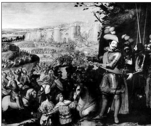
9. Vicente Carducho, 1634. La expugnación de Rheinfelden , 297 x 357. CAT P637.

imponerse por la fuerza y que debe actuar con disimulo y astucia. La técnica política se emparenta así con la técnica moral que deja de ser esfera de principios y creencias a imponer, para constituirse como ámbito del conflicto de intereses y de la negociación.