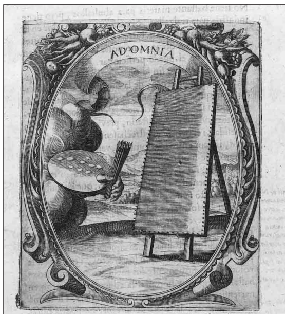
12. Saavedra Fajardo, Empresas políticas , Empresa 2. Ad omnia .

de la que nada sabemos, la presencia de las meninas sugiere que el juego tiene un carácter educativo, como lo tiene el espacio teatral en que transcurre, rodeado de cuadros de sentido alegórico y moralizante.