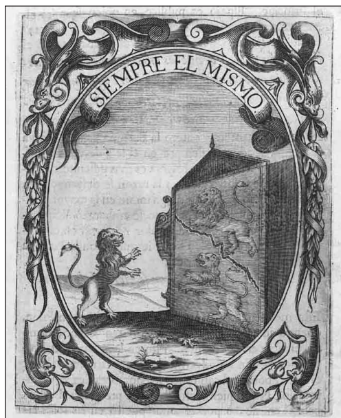
13. Saavedra Fajardo, Empresas políticas , Empresa 33. Siempre el mismo .

imagen que representa a la institución debe ser constante, sino que Saavedra insiste en lo que esta obligación supone para el propio monarca. Dado que todos ponen sus ojos en él, el rey ha de disimular sus aflicciones y mantener siempre el mismo semblante, sirviendo, podríamos decir, a su propia imagen. El espejo reduplicado al que se enfrenta el león de esta empresa expresa así las obligaciones del oficio del rey de forma análoga a como lo hacen Las Meninas , cuadro en que el rey se enfrenta a la duplicación de su imagen, en que se expone a la mirada de su hija y a la de aquellos que están más involucrados en el cuidado de la misma. Obligado a ser siempre el mismo , la imagen del rey se reduplica para llegar a los ojos de todos sus súbditos; esta imagen ideal ha de estar presente de esta manera en todos, tal como el alma está presente en todas las partes del cuerpo. Como afirma Saavedra en la empresa 22: ...como en el cuerpo humano., así en el del reino está en todo él y en cada una de sus partes entera el alma de la majestad . Una misma alma o cuerpo místico en multitud de cuerpos particulares, esta es la relación entre la idea de la soberanía y sus múltiples representaciones, pero también entre el rey y cada uno de sus súbditos.