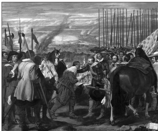
8. Diego Velázquez, 1635, La rendición de Breda, o Las lanzas , oil, 307 x 367, Museo del Prado, Madrid. CAT P01172.