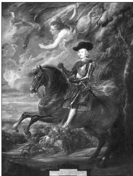
2. Rubens. 1634-1635. El cardenal-infante Fernando de Austria en la batalla de Nördlingen , ol/lz, 337,5 x 261. Museo del Prado, Madrid cat: PO1687.

las artes en tiempos paz 5 . La explicación de la empresa comienza con una reflexión sobre la imposibilidad de conocer a priori si determinada decisión resulta temeraria o prudente, descabellada o cobarde 6 : Todo depende , afirma Saavedra, de aquella eterna providencia que eficazmente nos mueve a obrar cuando conviene para la disposición y efecto de sus divinos decretos. Y entonces los consejos arrojados son prudencia; y los errores, aciertos . Pero a esta afirmación general le sigue alguna consideración sobre el momento histórico concreto y menciona Saavedra que en pocos años hemos visto rendidas a sus filos las vidas de (...) tan heroicos varones que no menos son gloriosos por lo que obraron que por lo que esperaba dellos el mundo . Entre estos valerosos capitanes menciona a Don Fadrique de Toledo y Osorio, uno de los héroes protagonistas de los triunfos militares representados en las pinturas del Salón de Reinos y se pregunta ¿Quién no inferirá desto la declinación de la monarquía de España...? La respuesta de Saavedra admite la decadencia del país