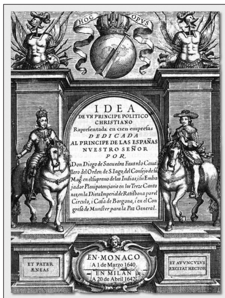
5. Saavedra Fajardo, Empresas políticas , Frontispicio.

superior inescrutable. La superposición de estos dos símbolos, esfera y pala, aparece también en la que pudiera ser una de las fuentes en que se inspiró el grabado de la portada de las Empresas . Se trata del grabado de Cornelis Galle para la edición de la obra completa de Lipsio en 1614, una obra que muy probablemente conoció Saavedra. Es en la figura femenina que representa a la política donde encontramos éstos símbolos que son aquí sus atributos definitorios. Con ello, la política misma se define como la habilidad en la dirección de la nave del estado 17 .