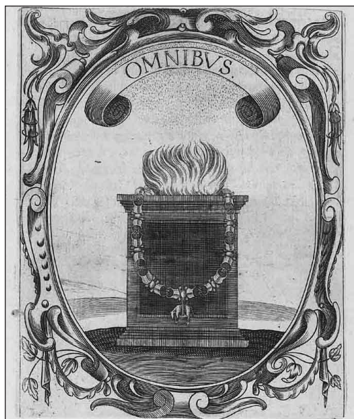
11. Saavedra Fajardo, Empresas políticas , Empresa 39. Omnibus .

tud 39 . Nieto recupera así los argumentos de Emmens y Serrera al proponer una comparación de la escena pintada por el sevillano y la empresa segunda del murciano, que habría podido tener como fuente literaria directa el emblema número 191 de Covarrubias.