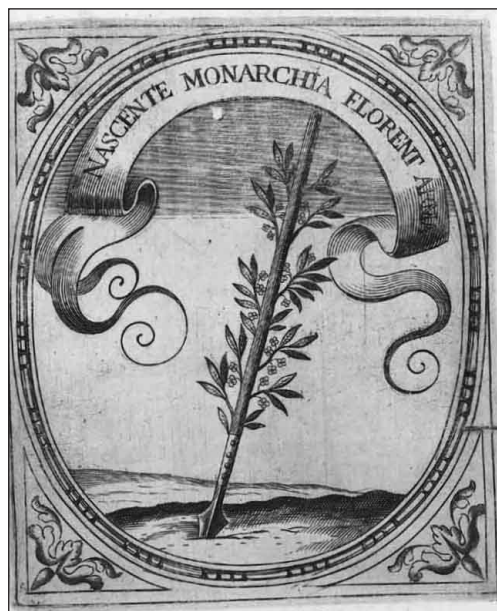
3. Saavedra Fajardo, Empresas políticas , Empresa 87. Auspice Deo .

En definitiva, ambos defienden la sustitución del tiempo escatológico por la previsión de futuro , previsión que se articula conceptualmente mediante un retorno al modelo circular de la antigüedad. Como afirma Koselleck, el propio carácter repetible de esta noción de la historia remite al pasado el futuro previsible 10 . Como hemos visto, Saavedra tenía una confianza escéptica en la capacidad humana de preveer el futuro, confianza relativa que le permite recurrir a la tradición de los espejos de príncipes para prevenir al monarca de los peligros futuros aprendiendo de los pasados. La empresa 28 resume esta concepción del tiempo presente en relación al pasado y al futuro recurriendo a la metáfora del espejo [IMAGEN 3]. Una serpiente que simboliza la prudencia se enrosca sobre el cetro del gobierno, ambos sobre un reloj de arena que simboliza el tiempo presente; pero a un lado y otro, dos espejos en los que se refleja la primera imagen simbolizan el pasado y el futuro, para concluir con la máxima: consúltese con los tiempos pasado, presentes y futuros 11 . Pero hacia el final del libro, en la empresa 87, el príncipe, sujeto a la rueda