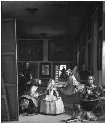
1. Diego Velázquez, 1656. Las Meninas ol/iz, 318 cm x 276 cm. Museo del Prado, Madrid.

La imagen heroica y triunfal de Carlos V en la batalla de Mühlberg o la de El cardenal-infante Fernando de Austria en la batalla de Nördlingen , de (Rubens, 1636), que celebra el triunfo provisional de los españoles en esta ciudad en 1634 y que dispone un escenario tan apocalíptico como el que Koselleck destaca en Altdorfer, participan del imaginario imperial [IMAGEN 1]. Pero