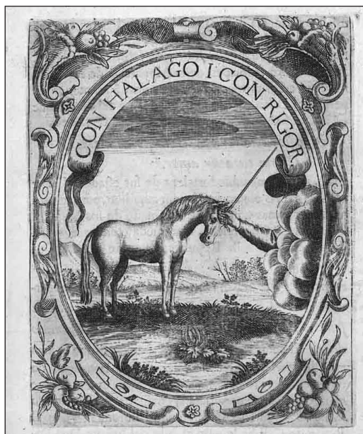
10. Saavedra Fajardo, Empresas políticas , Empresa 38. Con halago y con rigor .

Esta concepción pastoral del poder se desarrolla en la empresa siguiente, número 39, con una imagen en que el collar con el Toisón de Oro, cuelga de un altar ceremonial [IMAGEN 10]. En la explicación del símbolo del cordero dorado Saavedra sintetiza diversos motivos: la historia bíblica de Gedeón, guerro victorioso en la defensa del pueblo judío frente a sus enemigos; la simbología cristiana de Cristo como cordero y la identificación del monarca con la figura de Cristo; la legitimación de los Austrias, vinculada estrechamente a la Orden del Toisón; la asociación entre esta orden y el partido católico en las guerras de religión y, finalmente, la asociación entre los desvelos del príncipe católico por sus siervos y el sacrificio del pastor por su rebaño 25 . El sacrificio del pastor y el halago del monarca a sus súbitos no bastan obviamente por sí mismos, sino que necesitan de su complemento, el rigor en el ejercicio del gobierno y el temor que debe provocar en los gobernados.