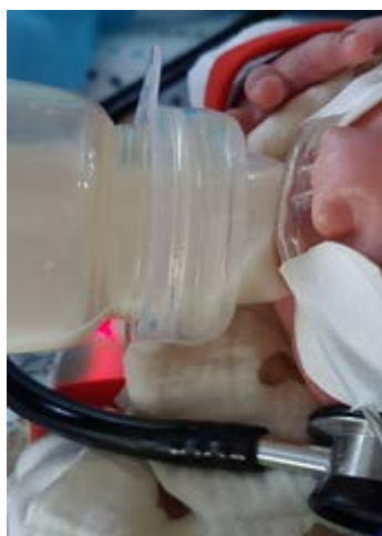
Figura 2. Alimentación de neonato con tetina WS-01 Pigeon.

Se aplicó la tetina WS-01 en RN que iniciaron alimentación en la semana 34 de EGC. Se utilizó durante 24 hrs en aquellos casos en que la madre no asiste, fraccionado en 4 alimentaciones diurnas y 4 nocturnas. Se evaluó el rendimiento según la variación de peso y se registraba en la hoja de enfermería. La reevaluación se realizó cada 24 hrs para decidir la mantención o cambio a tetina tradicional.