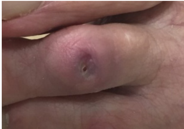
Fig. 5. Úlcera con 11 Semanas de evolución

y vendaje con descarga, finalizando las curas con coágulo de PRP. (fig.5)