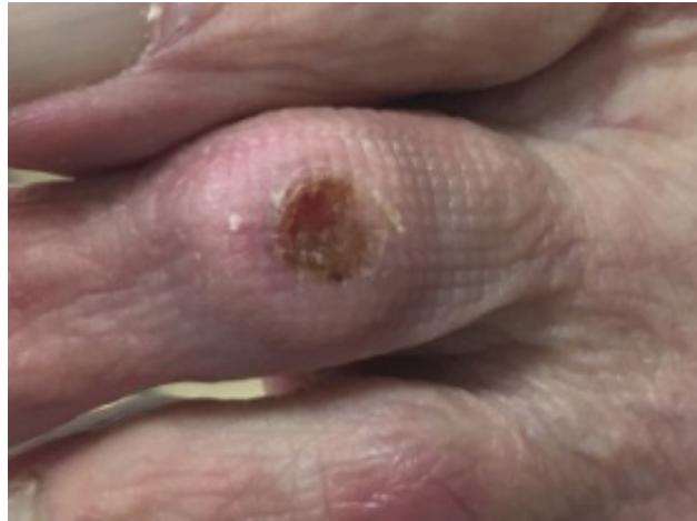
Fig. 4. Úlcera con 9 Semanas de evolución

9 Semanas de evolución, úlcera seca con pústula y sin exudado. (fig.4)