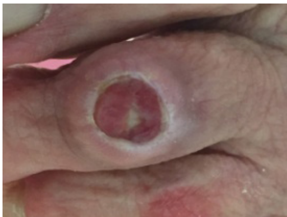
Fig. 3. Úlcera con 7 Semanas evolución

más granulación pero ligeramente macerados y menos profundidad en zona lateral. (fig. 3)