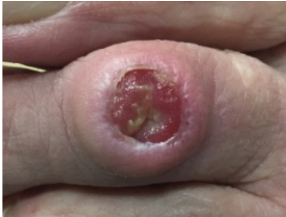
Fig. 2. Úlcera con tejido esfacelado y fondo de granulación de 0,6 cm de diámetro

6 Semanas de evolución, inicio de tratamiento con coagulo de plasma rico en plaquetas, úlcera con tejido esfacelado y fondo de granulación de 0,6 cm de diámetro, sin signos de infección, con bordes despegados, zona lateral más profunda. (fig2).