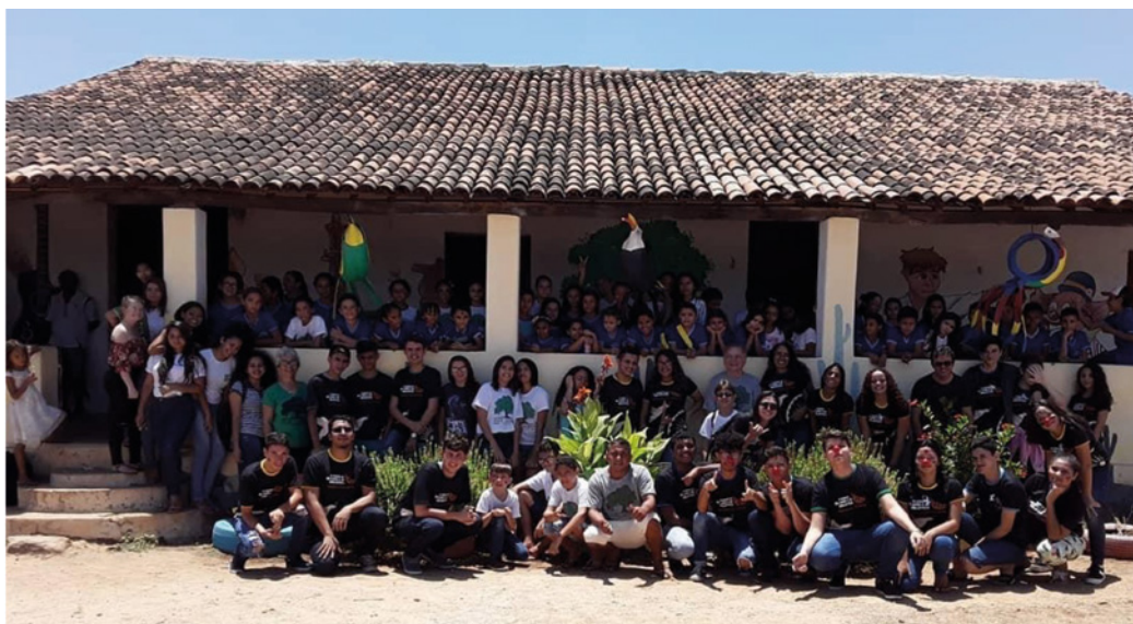
Figura 3. Personas voluntarias y participantes en la intervención creativa de 2019

La intervención creativa se realizó en el Instituto Zuza Laureano, una organización no gubernamental localizada en el pueblo de Vaca Morta localizado en la zona rural de la ciudad de Cedro. Este organismo tiene como objetivo promocionar la cultura de su comunidad y ofrecer espacio para que personas adultas y jóvenes puedan acceder a actividades físicas, profesionalizantes y recreativas. Otra institución que estuvo involucrada en la acción fue la escuela municipal Antonio Laureno de Oliveira, también ubicada en la misma zona, y que atiende a estudiantes de primaria. En la Figura 3 puede verse una imagen con personas voluntarias y participantes de la intervención creativa llevada a cabo.