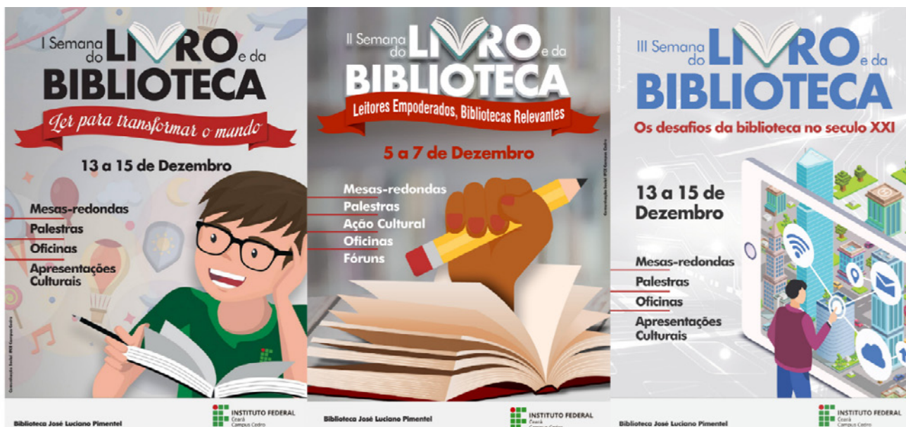
Figura 1. Carteles de las tres primeras ediciones de la Semana del Libro y de la Biblioteca del IFCE