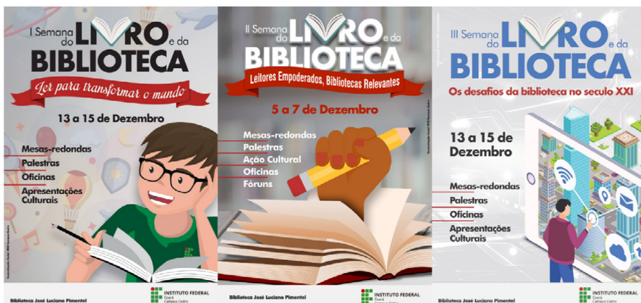
Figura 1. Carteles de las tres primeras ediciones de la Semana del Libro y de la Biblioteca del IFCE