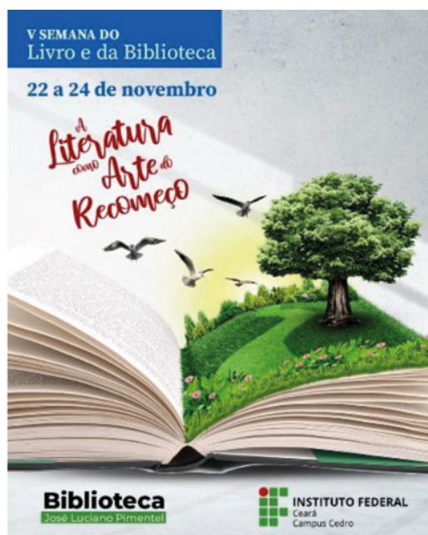
Figura 4. Cartel de la quinta edición de la Semana del Libro y de la Biblioteca del IFCE

La V Semana del Libro y de la Biblioteca del IFCE, campus Cedro, se celebró en 2022, cuando las restricciones de la pandemia ya se habían reducido. Por esta razón, el tema central fue “Literatura como el arte del comienzo” (Figura 4). El objetivo principal del evento era reflexionar sobre cómo la literatura podría ayudar a la gente a superar las dificultades ocasionadas por la pandemia. Para la intervención creativa, se subdividió el tema central en tres subtemas: poesía, cuento y cómics.