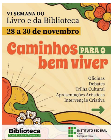
Figura 6. Cartel de sexta edición de la Semana del Libro y de la Biblioteca del IFCE

La VI Semana del Libro y de la Biblioteca del IFCE se realizó en 2023 y tuvo como tema central “Caminos para el buen vivir” (Figura 6). El objetivo principal del evento fue reflexionar a partir del concepto indígena de “Buen Vivir” o caminos para crear una sociedad más justa, igualitaria e integrada (Acosta, 2016). Para la intervención creativa, se subdividió el tema central en tres subtemas: armonía de las personas consigo mismas (en contraposición al consumismo); armonía con las otras personas (en contraposición al prejuicio) y armonía con el mundo (en contraposición con el cambio climático).