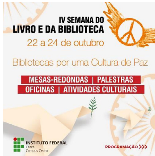
Figura 2. Cartel de la cuarta edición de la Semana del Libro y de la Biblioteca de IFCE

La IV Semana del Libro y de la Biblioteca del IFCE se realizó en 2019 y tuvo como tema central “Bibliotecas por una Cultura de Paz” (Figura 2). El objetivo principal del evento era discutir el papel de las bibliotecas en la construcción de una cultura de paz en la sociedad. Para la intervención creativa, se subdividió el tema central en tres subtemas: derechos humanos, medio ambiente y diálogo intercultural.