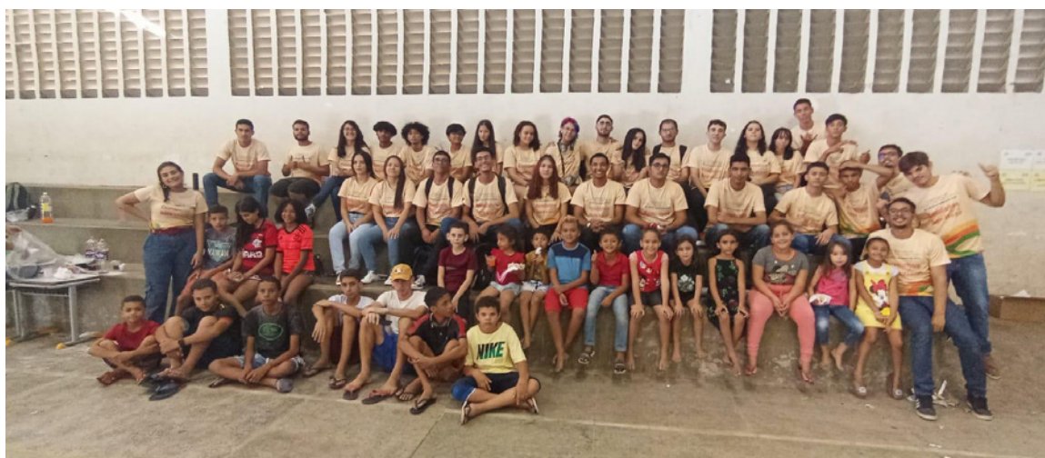
Figura 7. Foto de las personas voluntarias y participantes de la intervención creativa de 2023

En esta ocasión, las actividades se realizaron con personas jóvenes asistidas por el Servicio de Convivencia y Fortalecimiento de Vínculo de la Secretaría de Trabajo Social de la ciudad de Cedro. En la Figura 7 puede verse a las personas voluntarias y a las que participaron. Las personas jóvenes fueron reunidas en el espacio del polideportivo en el centro de la ciudad, donde tuvieron acceso a las rondas de conversación, a los talleres y a las actividades lúdicas organizadas y dirigidas por el equipo de treinta y tres voluntarios.