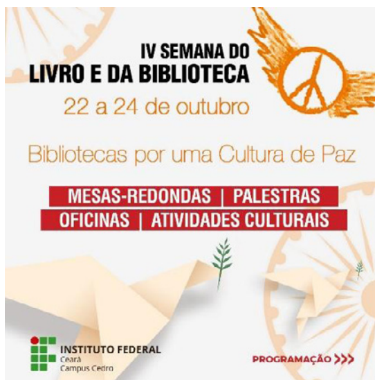
Figura 2. Cartel de la cuarta edición de la Semana del Libro y de la Biblioteca de IFCE

La IV Semana del Libro y de la Biblioteca del IFCE se realizó en 2019 y tuvo como tema central “Bibliotecas por una Cultura de Paz” (Figura 2). El objetivo principal del evento era discutir el papel de las bibliotecas en la construcción de una cultura de paz en la sociedad. Para la intervención creativa, se subdividió el tema central en tres subtemas: derechos humanos, medio ambiente y diálogo intercultural.