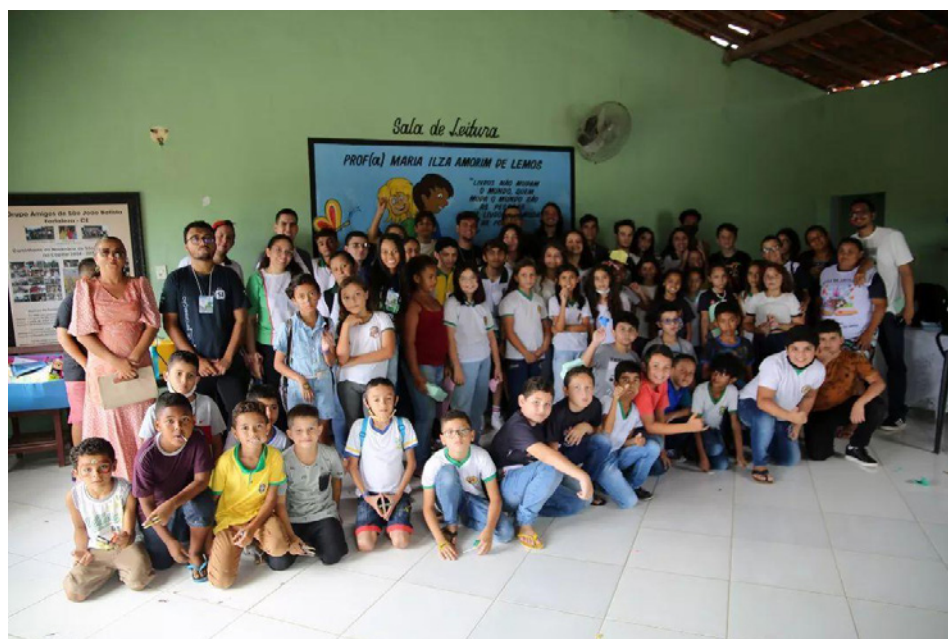
Figura 5. Foto de los voluntarios y participantes de la intervención creativa de 2022

En esta convocatoria se inscribieron veinte y nueve personas voluntarias. En la Figura 5 puede verse parte del equipo voluntario y participantes en la intervención. Al igual que en 2019, las personas participantes se dividieron en rondas de conversación, talleres, actividades lúdicas y soporte. Esta vez la intervención creativa se realizó en la periferia de la ciudad, en la Comunidad de Planalto dos Lemos (Cedro II), junto a su asociación de vecinos, la parroquia local y el estudiantado de dos escuelas de educación primaria de la región.