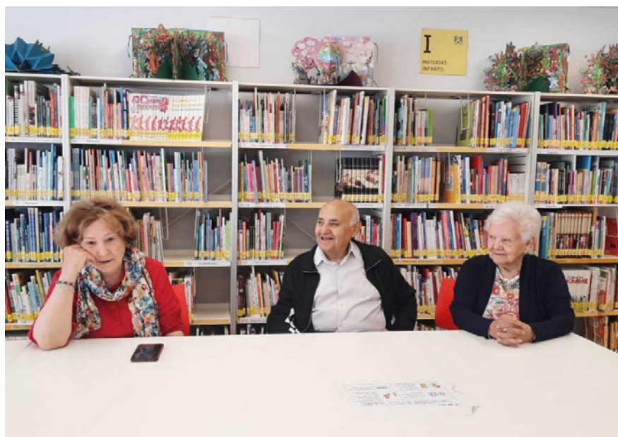
Figura 1. Personas del curso Mayores Conectados

La Biblioteca Ángel González se sitúa en Aluche, barrio de Madrid perteneciente al distrito de Latina. Cuenta con una población para el año 2023 de 66.588 personas, de las cuales el 28,66 % son mayores de 65 años; tiene un índice de sobreenviejecimiento del 39,28 % y un crecimiento sobre el mismo en 2023 de un 2% (Ayuntamiento de Madrid, 2023). Por ello, es preciso atender a las necesidades de la población según envejece y que crea nuevos desafíos en la sociedad. Uno de estos desafíos reconocido en el contexto de la Biblioteca Ángel González es la llamada soledad no deseada que provoca incomunicación, aislamiento y con ello exclusión (Yanguas et al., 2020).