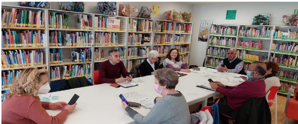
Figura 2. Sesión del curso Mayores Conectados

La biblioteca pública se identifica con esta última apreciación. A través de los anteriores ODS, se trataba de cumplir los siguientes objetivos específicos: