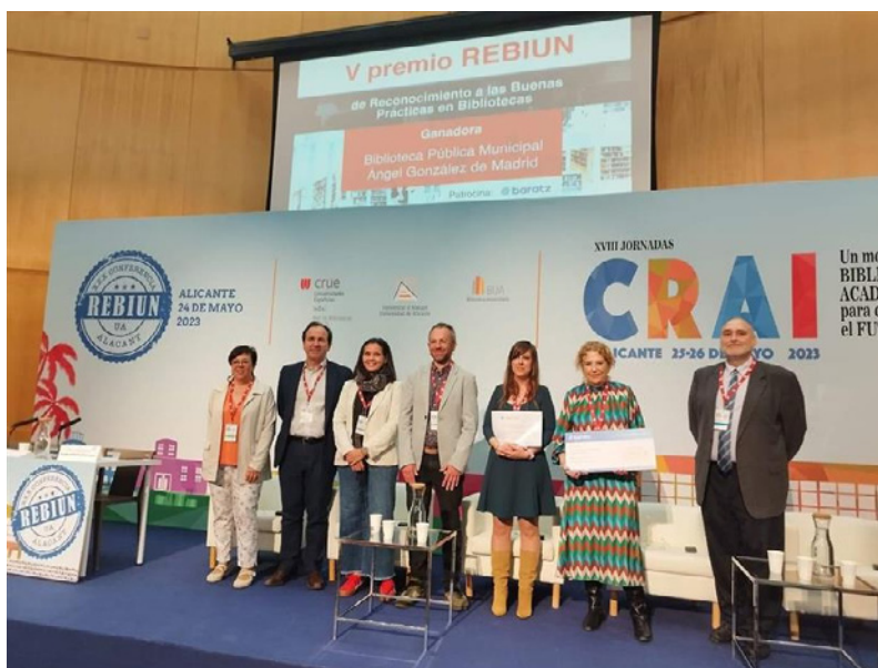
Figura 5. Ceremonia de entrega del Premio REBIUN.

El impacto del taller realizado se puede justificar también por los reconocimientos recibidos y alcanzados. El 12 de mayo de 2023, los miembros de la Comisión de Valoración del Premio REBIUN (Red de Bibliotecas Universitarias y Científicas Españolas), consideraron la candidatura de la Biblioteca Pública Municipal Ángel González de Madrid como merecedora del V Premio REBIUN de Reconocimiento a las Buenas Prácticas en Biblioteca (figura 5) 2 .