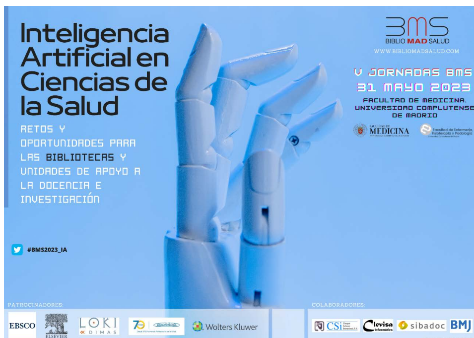
Figura 2. Cartel de las V Jornadas de BiblioMadSalud

El diseño de la cartelería deberá identificarse con el tema de la jornada e incluir tanto la información esencial del evento (título, fechas, ubicación, etc.), como incluir los logotipos oficiales de organizadores y patrocinadores (Figura 2).