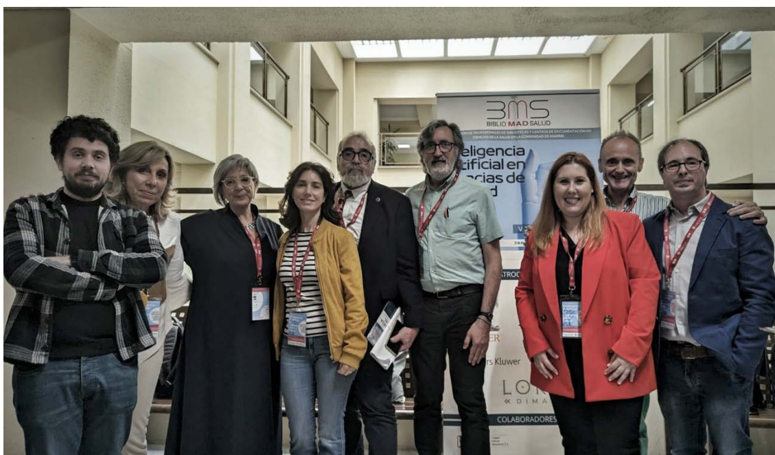
Figura 1. Comité Organizador V Jornadas BiblioMadSalud

Desde 2016, la realización de la jornada anual es una de las principales actividades de la asociación, y su gestión corre a cargo de un Comité Organizador (Figura 1) con el apoyo y representación del Comité Ejecutivo de BiblioMadSalud. En esta convocatoria, el Comité Organizador se ha compuesto mayoritariamente por profesionales de las bibliotecas de Medicina y de Enfermería, Fisioterapia y Podología de la Universidad Complutense, junto a tres representantes del Comité Ejecutivo de la asociación (BiblioMadSalud, 2023b).