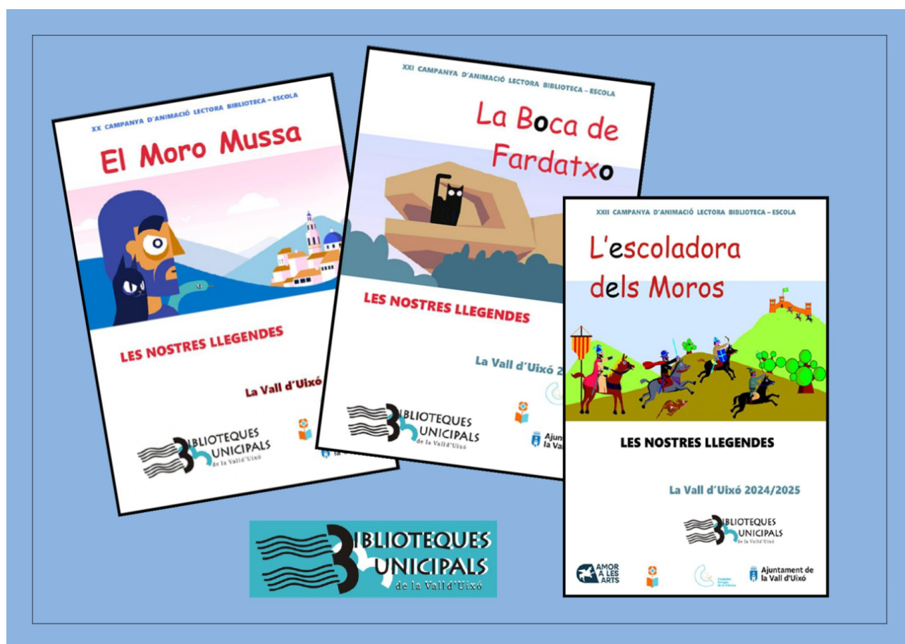
Figura 2. Imagen de carteles de diversas campañas de animación lectora sobre las leyendas locales