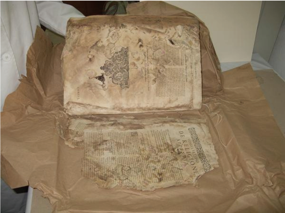
Figura 5: Ejemplo de obra almacenada sin criterios de conservación. Biblioteca Pública del Estado-Provincial de Córdoba

conjunto, y de acciones específicas, atendiendo a cada pieza individualmente para intentar su recuperación en la medida de lo posible. No obstante, la restauración debería ser el último recurso para la recuperación de un libro, debiéndose incidir más en los sistemas y técnicas de conservación, dejando la restauración para casos en los que sean estrictamente necesarios, aunque lamentablemente este último supuesto se da con mucha facilidad debido a la intensidad con la que los factores de deterioro anteriormente mencionados han venido actuando sobre el patrimonio bibliográfico gracias a la pasividad del hombre.