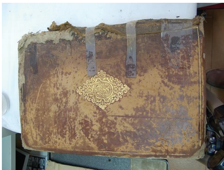
Figura 1: Libro deteriorado por el uso. Biblioteca Pública del Estado-Provincial de Córdoba

Entre ellos los más importantes por el impacto que ocasionan en los documentos pueden ser los originados por el uso. Como dijimos, los materiales sufren con cada uso del documento. Estos deterioros se deben a los depósitos que se originan, los residuos que se generan por el contacto con las manos que su vez transmiten infinidad de sustancias a los materiales, el abuso sobre el documento en forma de dobleces, roturas o marcas para resaltar el texto, grafismos dentro del texto original. Cuando multitud de deterioros parciales se dirigen en la misma dirección, provocan consecuencias que en muchos casos son irreparables o, cuanto menos, requieren de una intervención muy intensa y costosa para intentar devolver al su estado original las obras, en caso de que sea posible.