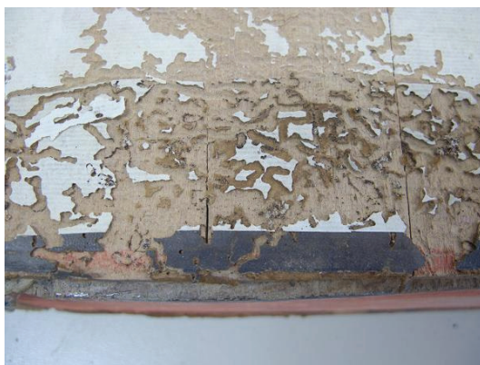
Figura 3: Ataque de insectos bibliófagos. Biblioteca Pública del Estado-Provincial de Córdoba

2.2. Condiciones del depósito: ataques de animales bibliófagos. Hasta no hace mucho tiempo, lo habitual eran estanterías de madera en el mejor de los casos. La función soportante la realiza bien, pues el material aguanta razonablemente bien el peso, pero genera una serie de problemas que repercuten en las obras. Su alta capacidad para absorber la humedad, la posibilidad de incendiarse, su acidez, o el ataque de plagas tales como insectos xilófagos, son características que afectan directamente a la estabilidad de los materiales que van a depositarse en ellas. En la actualidad disponemos de sistemas de almacenaje estancos e inertes, que mejoran la adaptabilidad a los distintos tamaños de las obras.