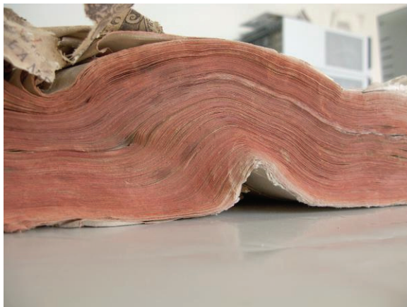
Figura 2: Deterioro por almacenamiento. Biblioteca Pública del Estado-Provincial de Córdoba

En esta imagen observamos el corte frontal de un libro. Las ondulaciones que se aprecian son fruto de los esfuerzos mecánicos que deben soportar los cuadernillos, para los que no están preparados. El peso excesivo ha provocado que cedan y, por una situación prolongada en esta posición, ha desembocado en el estado actual.