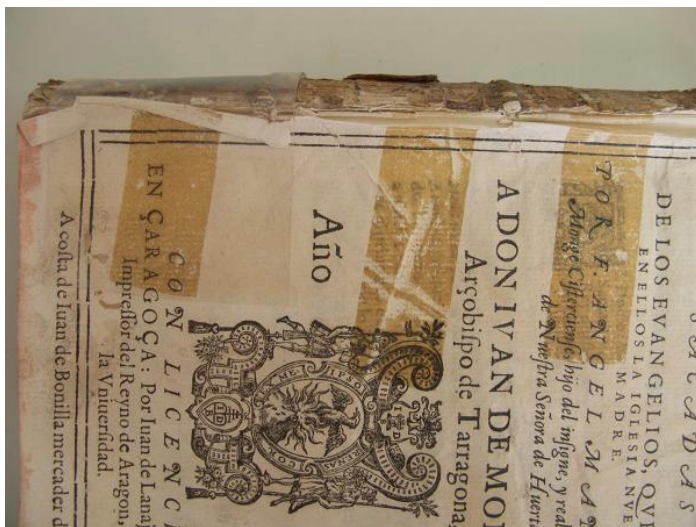
Figura 7: Deterioro por intervención inapropiada. Biblioteca Pública del Estado-Provincial de Córdoba

2.6. Restauración deficiente: Este tipo de deterioro incluye desde acciones efectuadas por personal sin conocimiento para hacerlas, hasta malos diagnósticos previos a la intervención producen resultados negativos para los libros. El empleo de materiales irreversibles o simplemente nada adecuados por sus características producen consecuencias que en ocasiones son tanto o más perjudiciales que el daño que intentaban solucionar.