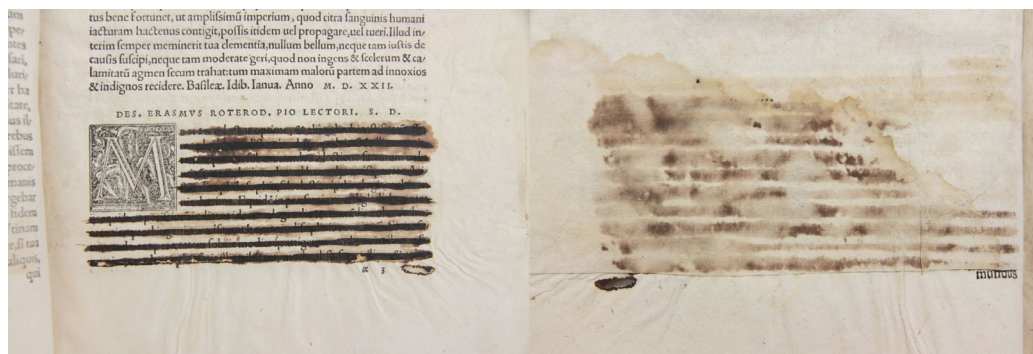
Figura 8: Deterioro por censura. Biblioteca Pública del Estado-Provincial de Córdoba

Las modificaciones que sufren los documentos normalmente están condicionadas por la acción del hombre. En esta imagen se observa el verso y el resto de un documento que ha sufrido la labor inquisitorial, provocando el tachado del texto con tintas ferrogálicas o de hierro, que han generado, por su composición, la pérdida del papel de soporte. Asimismo se observa la adhesión de un papel como medida para paralizar este deterioro. Son acciones con distintos objetivos que causan la desintegración del material.