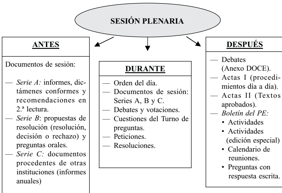
Gráfica n.º 2. Clasificación de la documentación del Pleno del PE.

De este modo, se agrupa esta documentación generada por la Eurocámara: