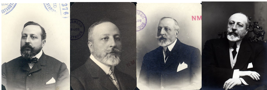
Figuras 5 a 8. Francisco Javier Sánchez-Dalp y Calonge , marqués de Aracena, fotografías desconocidos, entre 1896 y 1923. ACD, p-0308, p-0310, p-0312 y p-1046.

En relación a las técnicas y formatos, se trata en su mayor parte de copias en papel al gelatino-bromuro 15 que presentan una gran variedad de tamaños, desde los más pequeños tipo carnet de 3x3 cm hasta los más grandes de 32x22 cm característicos del formato boudoir , junto a otros como el cabinet de 11x16 cm o el imperial de 17x25 cm (Sánchez Vigil, 2018: 34-39).