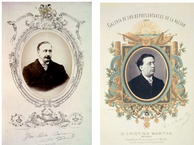
Figura 1. José Pardo Bazán , José Suárez, 1869. Fondo histórico, C 09317, Biblioteca del Congreso de los Diputados. Figura 2. Cristino Martos y Balbi , Leopoldo Rovira, 1869. Fondo histórico, CF 036, Biblioteca del Congreso de los Diputados

La petición del fotógrafo sería finalmente declinada en la Sesión de la Comisión de Gobierno Interior del 31 de marzo de 1869 10 , aunque Rovira realizó igualmente su galería, que posteriormente la Biblioteca del Congreso adquirió, posiblemente hacia 1875, pues en las páginas iniciales figura un sello de ese año, cabe pensar que con motivo de su ingreso o registro en el catálogo. Junto a esto, el ejemplar contiene además un índice manuscrito fechado en el año 1872 donde figuran los nombres de todos los diputados retratados 11 .