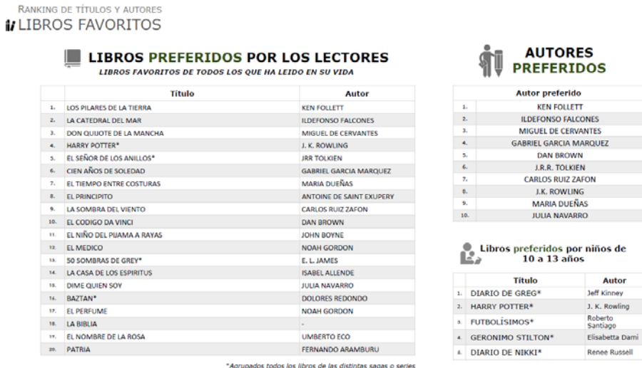
Figura 1. Libros preferidos por los lectores.

Esta condición la cumplen escasas obras que forman parte de los bestsellers contemporáneos. Tomando como referente la relación de obras preferidas por los lectores entre las leídas en toda su vida (Hábitos de compra, 2019) nos encontramos con la siguiente lista: