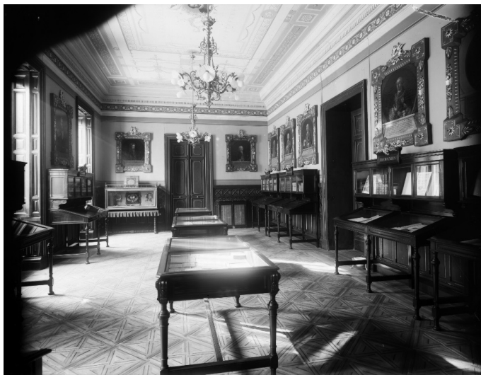
Figura 1. Fotografía de la sala de directores de la Real Academia Española.

Como efectivamente puede observarse en la fotografía del Archivo Moreno que se conserva en la fototeca del Ministerio de Cultura, a principios del s. XX la Academia exhibía en una vitrina situada en la Sala de Directores de la sede de Felipe IV, debajo del retrato de su primer director, el marqués de Villena, varios objetos de José Zorrilla: unas coronas, un almohadón, una caja y unas plumas (Figura 1).