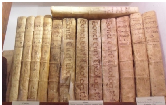
Figura 2. Detalle de títulos religiosos en la Biblioteca Membrado