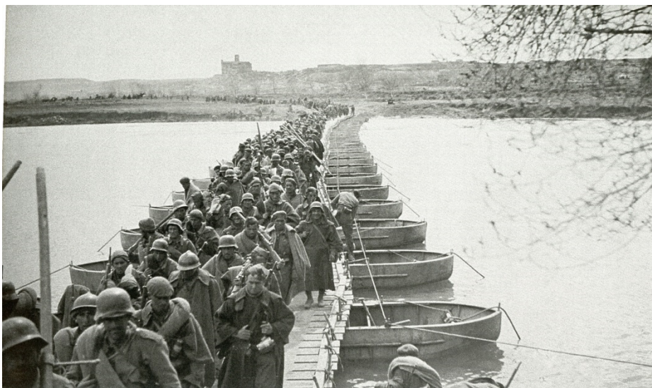
Fig. 11. Paso del río Ebro por un puente de barcasas tendido en Quinto por los pontoneros de Zaragoza. Era la ofensiva final contra el Aragón republicano. 23 de marzo de 1938.