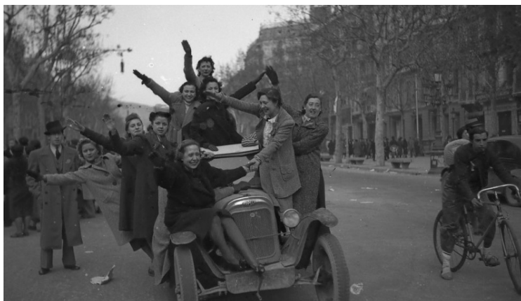
Fig. 16. Entrada de las Tropas de Yagüe en Barcelona. 26-30, enero, 1939. Paseo de Gracia, Barcelona. Coche de marca "Topelli". Celebración de civiles de la entrada de los nacionales en la Ciudad Condal. Autor: Francisco Martínez Gascón. Fuente: Archivo Familiar Martínez Gascón.