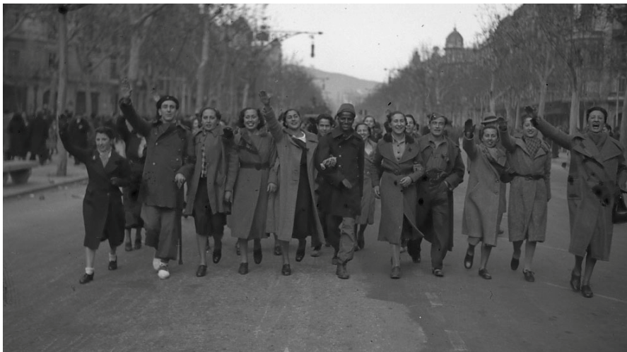
Fig. 17. Entrada de las Tropas de Yagüe en Barcelona. 26-30, enero, 1939. Paseo de Gracia, Barcelona. Celebración de civiles de la entrada de los nacionales en la Ciudad Condal. Autor: Francisco Martínez Gascón. Fuente: Archivo Familiar Martínez Gascón.