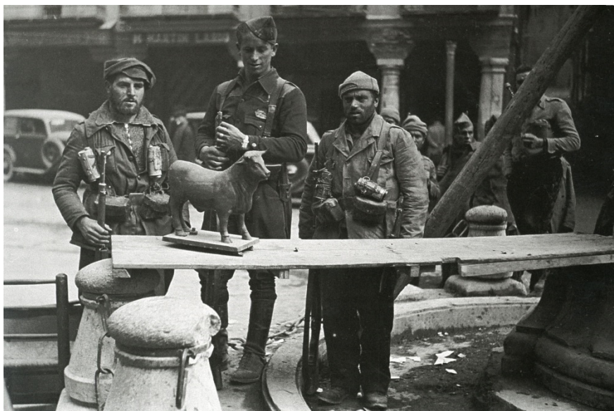
Fig. 10. Soldados con el “torico” de Teruel, tras la recuperación de la ciudad por las tropas de Franco. Febrero de 1938.