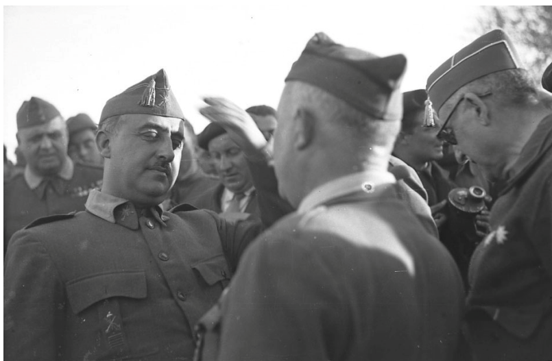
Fig. 12. Enero, 1939. Batalla del Ebro. El General Franco entre Jefes y Oficiales. Autor: Francisco Martínez Gascón. Fuente: Archivo Familiar Martínez Gascón.

En el mes de abril, en Heraldo de Aragón se reproducen imágenes de Zaragoza, realizadas por Martínez Gascón. Ocupando, muchas de ellas, las portadas del rotativo. No se encontraron referencias de salvoconductos y/o autorizaciones entre junio de 1938 y enero de 1939. Sabemos que sigue fotografiando el frente gracias a las imágenes encontradas en el domicilio familiar y las que se visionaron en los rollos de microfilms de la hemeroteca. A continuación se reproducen algunas de las imágenes localizadas en el domicilio familiar y que corresponden a la Batalla del Ebro (figuras 12 y 13).