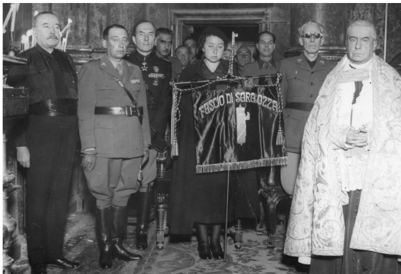
Fig. 5. Fascio di Saragozza. 1936-1939 c.a.

En febrero de 1937 el fotógrafo se encuentra en Perdiguera en la entrega de banderines de combate (figura 6).