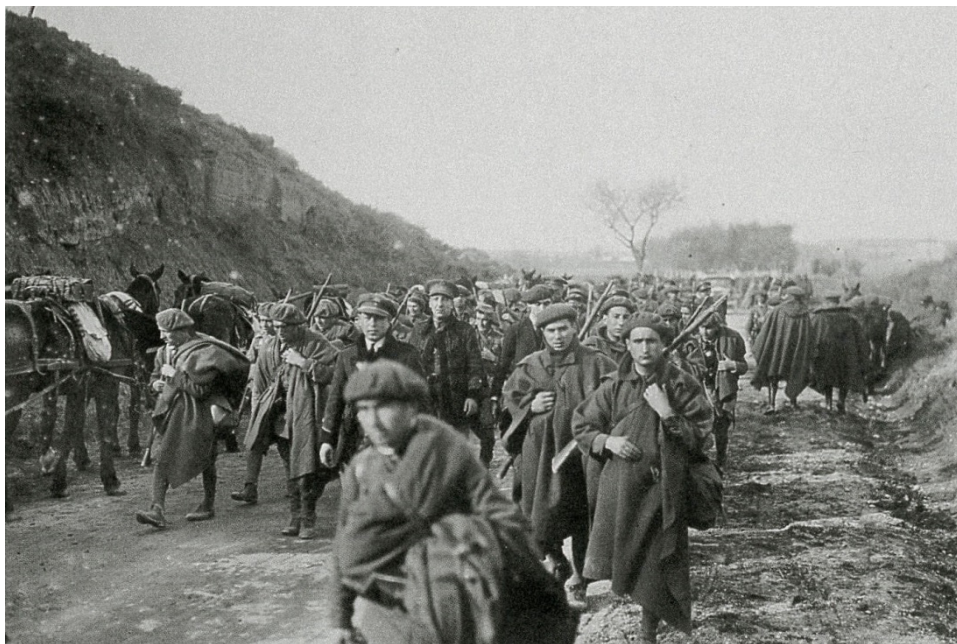
Fig. 1. Tropas leales al Gobierno, marchando al encuentro de las unidades que seguían a Galán y García Hernández. 12-13 de diciembre de 1930.