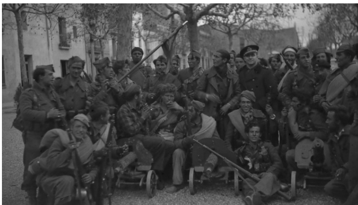
Fig. 15. Entrada de las Tropas de Yagüe en Barcelona. 26-30, enero, 1939. Unidad de ametralladoras. Entrada de los nacionales en la Ciudad Condal. Autor: Francisco Martínez Gascón. Fuente: Archivo Familiar Martínez Gascón.

que aportan, sino también por lo que representan en lo más personal. Se ven, por un lado, imágenes muy cercanas y muy personales, de cierta camaradería entre soldados y altos mandos. No son posados. Por otro lado, se ve también, mucha cercanía entre el fotógrafo y el propio General Yagüe (algo llamativo, teniendo en cuenta la importancia dentro del Movimiento y a lo largo de la Guerra Civil del general). Y se ve el trabajo de un fotógrafo vivaz que dispara su máquina en la antesala de la toma de la ciudad de Barcelona, en sus calles, las celebraciones de civiles y militares y el discurso de Yagüe en la Plaza de Cataluña (figuras 15, 16, 17 y 18).