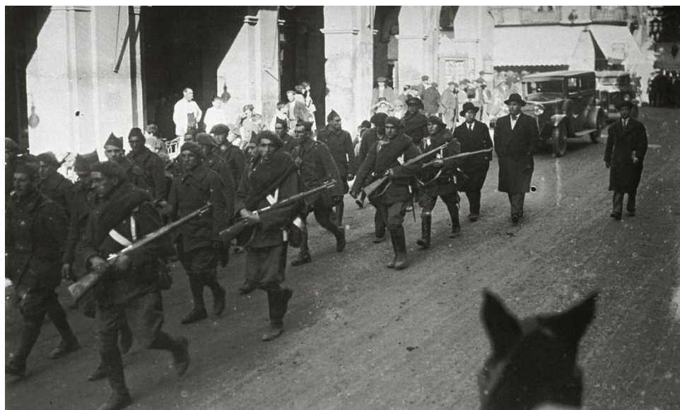
Fig. 3. Los sublevados, hechos prisioneros, son conducidos por las calles de Huesca. 12 de diciembre de 1930.