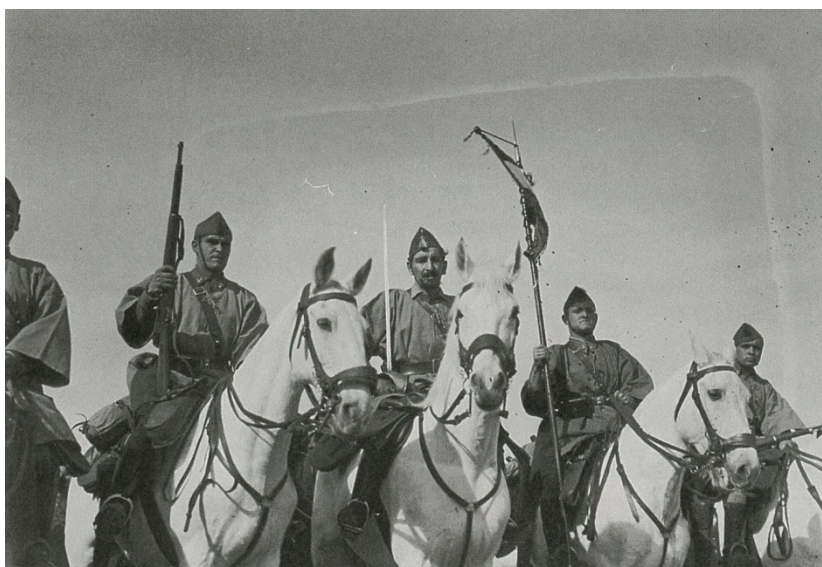
Fig. 6. Perdiguera, entrega de banderines de combate. 13 de febrero de 1937.

En febrero de 1937 el fotógrafo se encuentra en Perdiguera en la entrega de banderines de combate (figura 6).