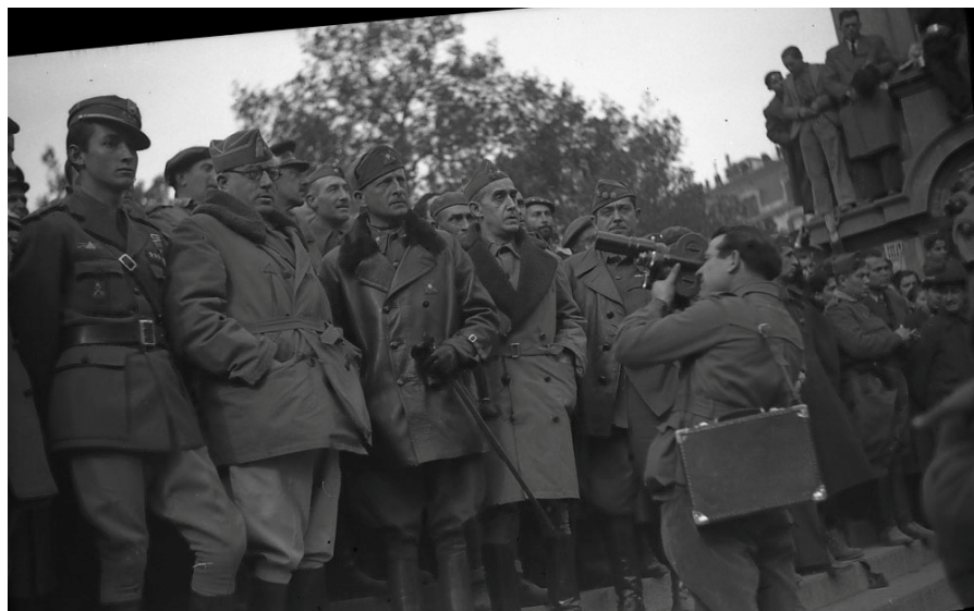
Fig. 18. Entrada de las Tropas de Yagüe en Barcelona. 26-30, enero, 1939. Yagüe en la celebración de la victoria de las tropas nacionales en Barcelona realizando su discurso. Autor: Francisco Martínez Gascón. Fuente: Archivo Familiar Martínez Gascón.

El siguiente gran hito del fotógrafo (y casi el último de estas características) será realizar con su cámara las imágenes del Desfile de la Victoria en Madrid, el 19