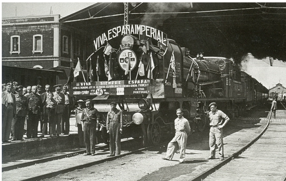
Fig. 7. Locomotora de la línea del Norte, engalanada con motivo de la toma de Bilbao por las tropas franquistas. 22 de junio de 1937.