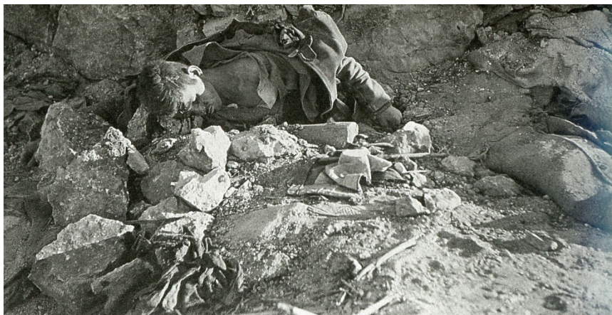
Fig. 8. Soldado muerto en los combates sostenidos en el frente de Belchite. Marzo de 1938.