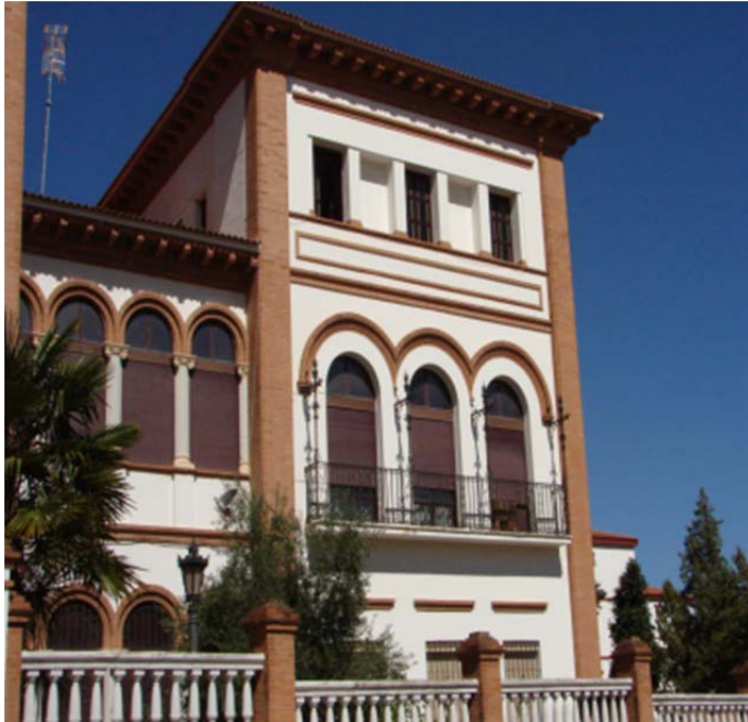
Figura 1. Dependencias actuales del Seminario de Badajoz

El archivo se crea a la vez que se instituye el Seminario según consta en las Constituciones que se aprobaron para la vida cotidiana del centro, en su Título 27. Veamos unas líneas que así lo demuestran: