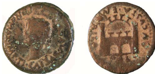
Figura 3. Sección Numismática del Archivo Seminario San Atón de Badajoz

Monedas 6.02: el gabinete numismático de san Atón es sumamente importante, máxime si tenemos en cuenta que la Numismática es como la Archivística, ciencia auxiliar de la historia. Se trata de una colección de más de 5000 monedas desde el siglo III a.C. que está siendo debidamente catalogada y cumplimentada para ser puesta al servicio de la sociedad como documento histórico.