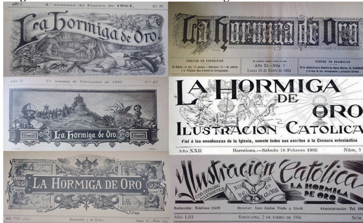
Figura 3. Cabeceras de la revista La Hormiga de Oro . Años 1884-1936