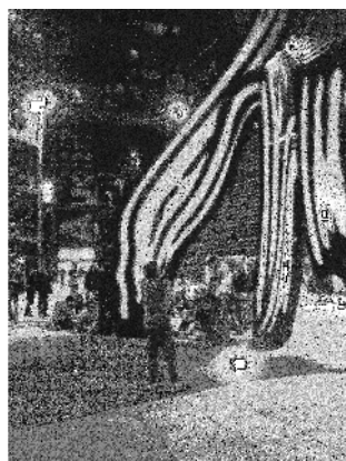
Encierro en el Reina. Fotografía del autor (2013)