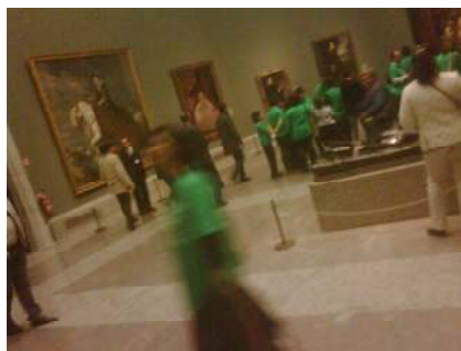
Plataforma por la Educación Pública de Pozuelo y Aravaca (2013)

La Marea Verde y la Marea Blanca visitan el Museo del Prado 5 . Se detienen en Goya: Niños con perro de presa , 1786: “el poder, el control y la fuerza ciudadana”. La gallina ciega , 1787: “así juegan los políticos con nosotros”. Muchachos trepando un árbol , 1791-92: “la organización y ayuda entre ciudadanos para conseguir objetivos comunes”. El pelele , 1791-92: “así acabaremos bajo el interés privado”. La ermita de San Isidro el día de la fiesta , 1788: “una democracia alegre y participativa”. Pastor tocando la dulzaina , 1786-7: “las artes y la cultura como refuerzo indispensable para la democracia”. Los pobres en la fuente , 1786-7: “desgraciada situación de mucha gente hoy”. El albañil herido , 1786-87: “el futuro de la sanidad si no lo evitamos”.