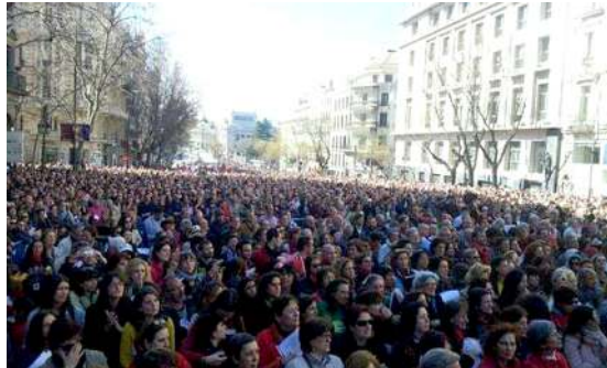
Manifestación Todos somos cultura. D.C. Madrid (2014)