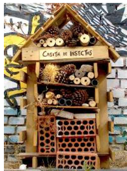
Casita de insectos de Ésta es una plaza. Fotografía del autor (Madrid, 2013)

En el Centro Social Ocupado EKO, en Carabanchel, apareció una pintada en verde en sus paredes: “Libertad para los artistas”. No sabemos verdaderamente qué los detiene o de qué se les acusa. Ni quiénes piden su libertad. Tampoco qué clase de arte hacen estos artistas o harán cuando recobren la libertad. Si la recobran. Al tiempo que en un centro ocupado se grita por la libertad de los artistas, en otro lado de la ciudad, en un festival financiado por una fundación cultural bancaria, un grupo de artistas se plantean dejar de serlo , pero no tenemos claro siquiera que alguna vez lo hayamos sido 14 .