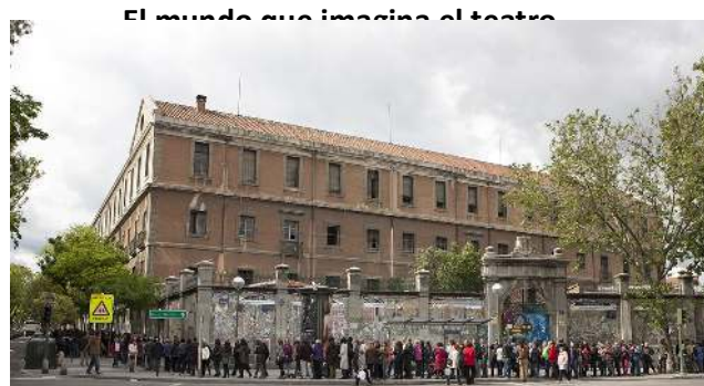
Cola a la entrada de la ópera. CS Tabacalera de Lavapiés. Juan Martín Zarza (2013)

Con toda modestia, debo admitir que nada es inventado: ángeles, sombras, lirios de nieve y sueños existen y vuelan entre vosotros tan reales como la lujuria, las monedas que lleváis en el bolsillo o el cáncer latente en el hermoso seno de la mujer o el labio cansado del comerciante. [...] Todo lo que hacéis es buscar caminos para no enterarse de nada. Cuando suena el viento, para no entender lo que dice, tocáis la pianola; cubrís de encajes las ventanas; para poder dormir tranquilos y acallar al perenne grillo de la conciencia, inventáis las casas de caridad [...] La realidad empieza porque el autor no quiere que os sintáis en el teatro, sino en la mitad de la calle; y no quiere, por tanto, hacer poesía, ritmo, literatura; quiere dar una pequeña lección a vuestros corazones; para eso es poeta, pero con gran modestia. Cualquiera lo puede hacer. [...] El olor de los lirios blancos es agradable, pero yo prefiero el olor del mar. Yo puedo decir que el olor del mar mana de los pechos de las sirenas, y mil cosas más, pero a él ni le importa ni lo oye, él sigue llamando a las costas en espera de nuevos ahogados, esto es lo que le importa al hombre. Pero ¿cómo se llevaría el olor del mar a una sala de teatro o cómo se inunda de estrellas el patio de butacas? 28 .