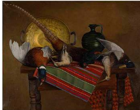
Creación política. Reproducción de un bodegón pintado por Francisco Franco. Levi Orta (2014)

La Plataforma de Artistas Antifascistas , que ideó un sencillo método para la ‘agencia’ antifascista 11 , organizó una exposición colectiva en un espacio autogestionado de un barrio popular de Madrid para denunciar la falta de libertad de expresión en el arte (a propósito de la censura de una obra en ARCO) aunque se limitó y restringió el acceso a la misma al “enemigo” 12 . Tuvo mucho de feliz escarnio al dictador por lo que puede que existieran muchas razones para actuar así. Mucha gente del barrio celebró la exposición y, sin desdeñar el valor de este acto antifascista y la acogida que tuvo, puede deberse a una cuestión de afinidad ideológica. Hecho que, quizá, vuelve menos pública la acción. Quizá también en relación a la vida de uno mismo, pues hemos decidido ser antifranquistas y no simplemente anticapitalistas, lo que comprometería nuestras vidas quizá de un modo más grave. Recientemente, esta misma plataforma ha realizado una venta de obras de arte y una campaña de donaciones para financiar el levantamiento de una fosa común de la Guerra Civil española en Monte de Estépar 13 , Burgos, lo cual no es cuestionable. Una pieza de una de las obras, venida del mismo tiempo y la misma guerra, de la misma posibilidad de morir, se perdió durante la