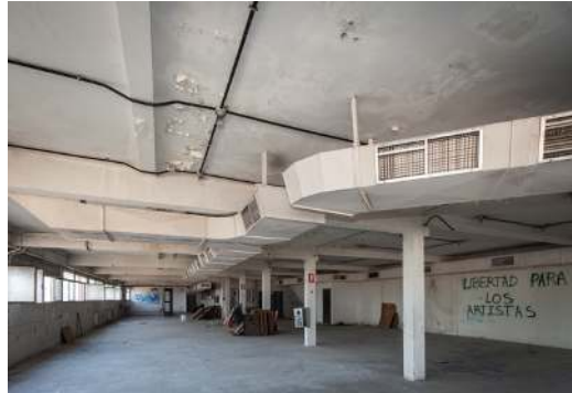
EKO @pollobarba (2013)

En el Centro Social Ocupado EKO, en Carabanchel, apareció una pintada en verde en sus paredes: “Libertad para los artistas”. No sabemos verdaderamente qué los detiene o de qué se les acusa. Ni quiénes piden su libertad. Tampoco qué clase de arte hacen estos artistas o harán cuando recobren la libertad. Si la recobran. Al tiempo que en un centro ocupado se grita por la libertad de los artistas, en otro lado de la ciudad, en un festival financiado por una fundación cultural bancaria, un grupo de artistas se plantean dejar de serlo , pero no tenemos claro siquiera que alguna vez lo hayamos sido 14 .