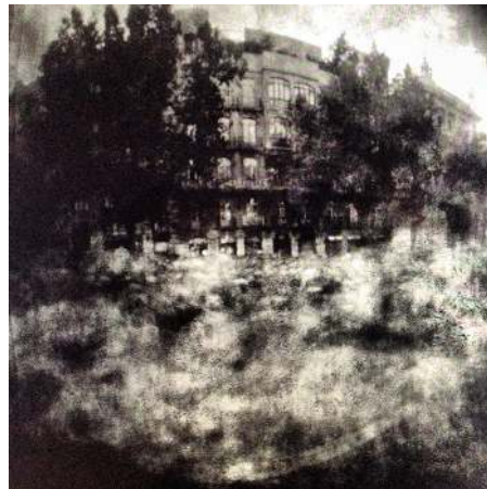
Algo se mueve en la base. Solarigrafía de Diego López Calvín (2013)

Durante la llegada de las Marchas por la Dignidad a Madrid 20 , la única tela que pudimos ver -sin tener en cuenta la ropa- que no se constituyera en la forma simbolizante de la bandera, o informante de la pancarta, era un río. “Puesto que la tierra es carne de Dios, haz lo que ella; contempla sus misterios y alumbra tú mismo como alumbra ella” 21 .