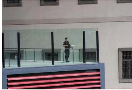
Terraza del Reina Sofía.

Porta un H&K G36C durante el acto conmemorativo del XXV aniversario de la Real Asociación Amigos del Museo Nacional Centro de Arte Reina Sofía, el 25 de septiembre del año 2012. Casi todo el mundo confundimos una cosa con la otra 10 , pero también podría afirmarse que se trata efectivamente de lo mismo. Cada institución en su lugar y la policía en el de todos.