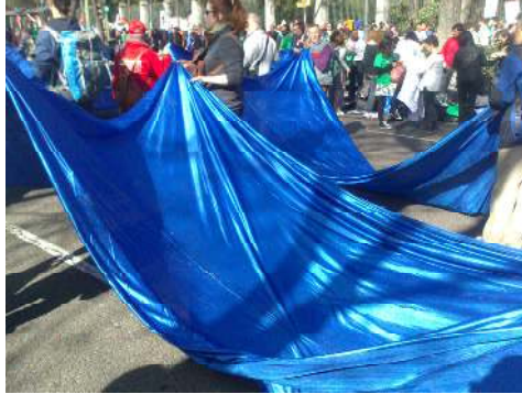
No a la privatización de Canal de Isabel II. Marchas por la dignidad.

Durante la llegada de las Marchas por la Dignidad a Madrid 20 , la única tela que pudimos ver -sin tener en cuenta la ropa- que no se constituyera en la forma simbolizante de la bandera, o informante de la pancarta, era un río. “Puesto que la tierra es carne de Dios, haz lo que ella; contempla sus misterios y alumbra tú mismo como alumbra ella” 21 .