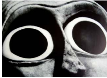
Detalle de la visión de la mujer. Grupo de Tell Asmar (2775 a.C. ≈)