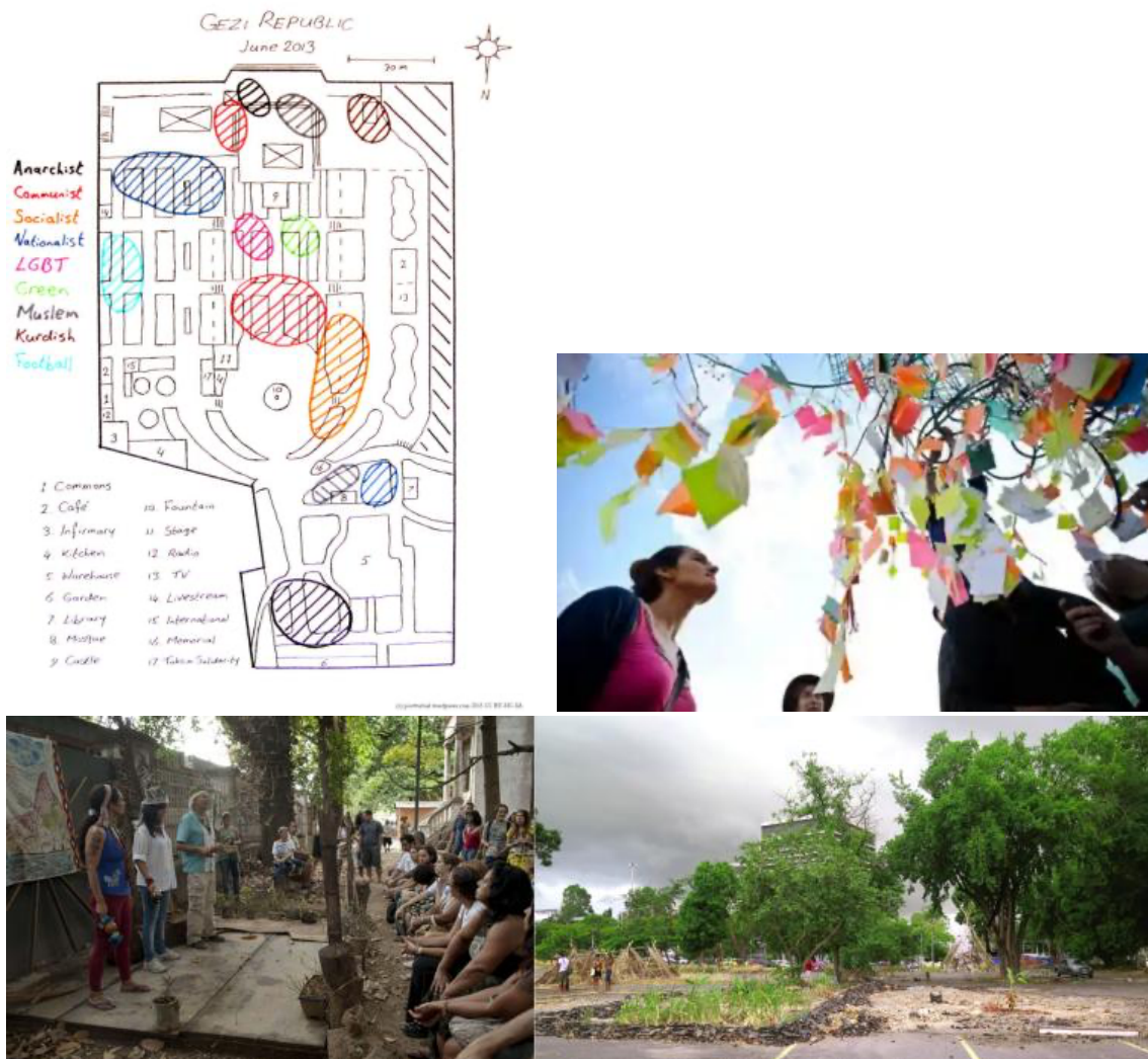
Figura 6. Gezi Republic.