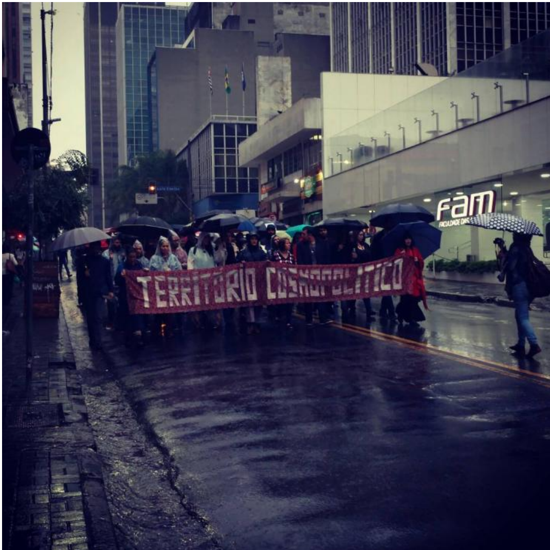
Figura 23. Movimento Fica Ficus de Belo Horizonte. Figura 24. Recorrido con la "bruja" Starhawk realizado en São Paulo el 21 de mayo de 2017. Figura 24 (b). Recorrido con la "bruja" Starhawk realizado en São Paulo el 21 de mayo de 2017