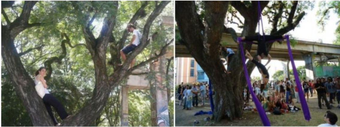
Figura 26. Acción Copa nas copas, en porto Alegre, 16 de febrero de 2013.