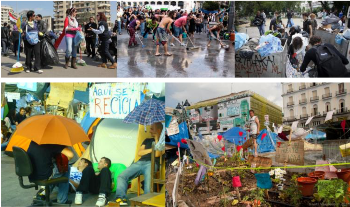
Figura 2. Limpiando en la plaza Tahrir de El Cairo (24/02/11, Caravan), la puerta del Sol de Madrid (12/06/11, Juan Plaza) y la plaza Taksim de Estambul (02/06/2013, Nar Photos). Figura 3. Izda: Punto de reciclaje de la Acampada Sol de Madrid, Foto: Virginia Dorta. Dcha: Huerto de Acampada Sol, Foto: Santi Vaquero.

Brasil estableció como ningún otro país conexión con las revueltas turcas. En junio de 2013, unos días antes de que estallaran en Brasil las protestas del Movimento Passe Livre (MPL) por la bajada de la tarifa del transporte urbano, el colectivo Fica Ficus de Belo Horizonte realizó un debate digital con los acampados del parque Gezi. A partir de entonces, la relación turcobrasileña fue en aumento. La conexión entre el Movimento Parque Augusta de São Paulo y Diren Gezi fue especialmente fructífera. Ambos movimientos escribieron el manifiesto Reclaiming our parks 6 e impulsaron una alianza global en defensa de los «bienes comunes urbanos» y de la gestión comunitaria de los mismos.