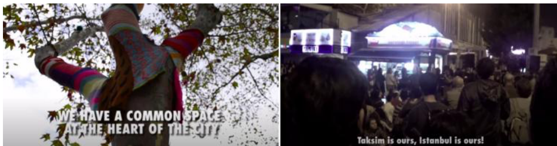
Figura 4. Fotogramas del proyecto 'Mapping the commons Istanbul', Pablo de Soto & Hackitectura, 2012.

Escena 1. Una mujer de pelo canoso habla en un corro en el parque Gezi: "Para que construyan un edificio hay una condición: que el parque esté vacío. ¿"Entonces, amigos, ¡ocupadlo!", concluye.