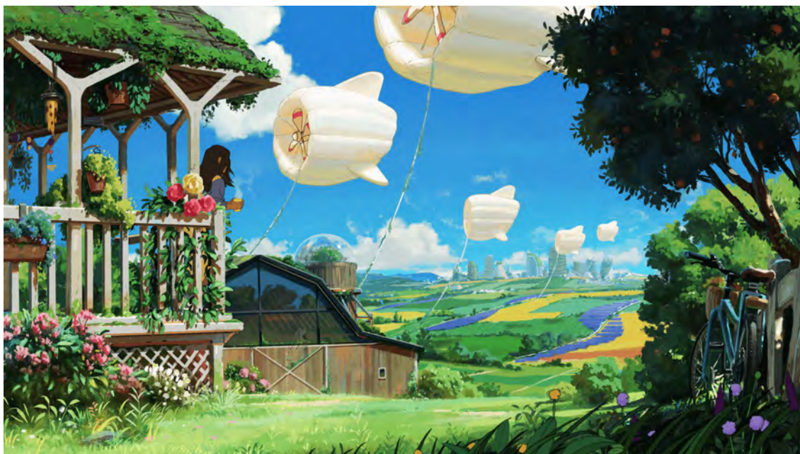
Imagen 3: Fotogramas del anuncio publicitario Dear Alice , producido por The Line y estrenado en 2021. Enlace: https://www.thelineanimation.com/work/chobani