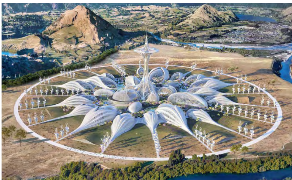
Imagen 1: Pollinator Park , Bird's Eye View - Organic Masterplan, 2021, Vincent Callebaut. Ilustración digital. Enlace: https://vincent.callebaut.org/zoom/projects/210323_pollinatorpark/polinnatorpark_pl014

La idea detrás del proyecto es imaginar una Europa devastada climáticamente en el año 2050. En ella se situaría al Pollinator Park como un espacio controlado en el que encerrar la naturaleza perdida con la crisis y así poder cultivar internamente lo que ya es imposible al aire libre. Los diseños publicados en la página web del arquitecto muestran un edificio de nueva construcción que recuerda a los estambres, pistilo y corola de una flor. En él se observa un gran número de habitáculos que harán la función de invernaderos y estancias para empleados. El edificio, según apunta la información disponible en la publicación, estaría construido en madera con una techumbre de escudos solares. Aunque los planos del edificio esbozan un espacio en el que hipotéticamente se cultivará bajo condiciones simuladas de naturaleza en las que se utilizan insectos para polinizar las plantas, el propio concepto del proyecto es debatible. Por un lado, requiere en gran parte de materiales escasos —los componentes necesarios para generar células fotovoltaicas—, así como de grandes costes de mantenimiento —también derivados de la inmensa instalación eléctrica—. Además, la ficción hipotética en la que se imagina el proyecto lo ubica en un aislado valle de Montenegro, haciendo que el transporte de alimentos orgánicos a la ciudadanía que lo consumirá se prolongue en el tiempo y sea más costoso.