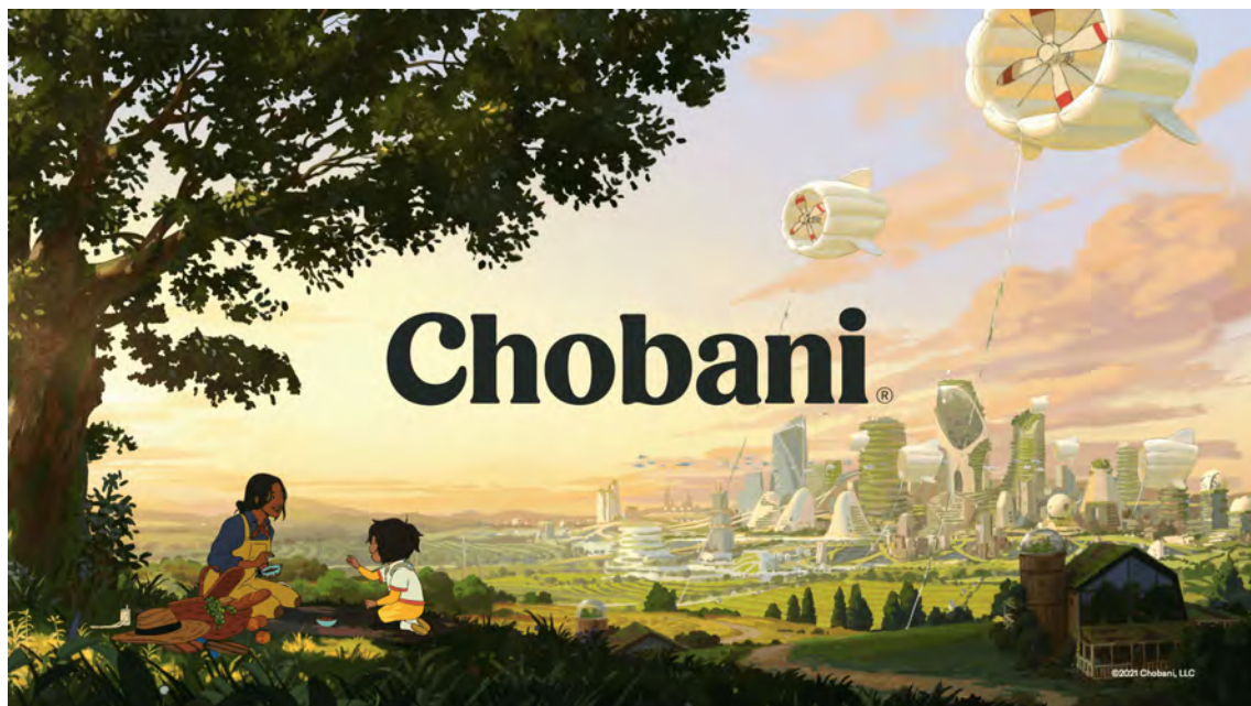
Imagen 5: Fotograma final del anuncio publicitario Dear Alice , producido por The Line y estrenado en 2021. Enlace: https://www.thelineanimation.com/work/chobani