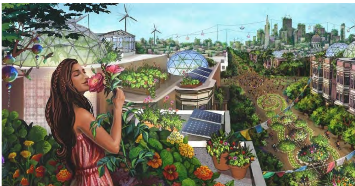
Imagen 6: The Fifth Sacred Thing , Jessica Perlstein, Sin Fecha. Ilustración digital. Enlace: https://jessicaperlstein.com/products/the-fifth-sacred-thing-1

novela de Starhawk— y se puede observar un sentido de urbanismo que emplea tanto tecnologías fotovoltaicas y eólicas como diferentes modos de cultivo urbano apenas sofisticados. Vemos, además, calles en las que el transporte es o bien peatonal o bien en bicicleta, con un gran espacio destinado a la vegetación. Quizás de manera más disruptiva en relación con los anteriores objetos, la autora no genera un nuevo urbanismo, sino que los edificios ya existentes han sido adaptados o reconvertidos a un nuevo paradigma ecológico.