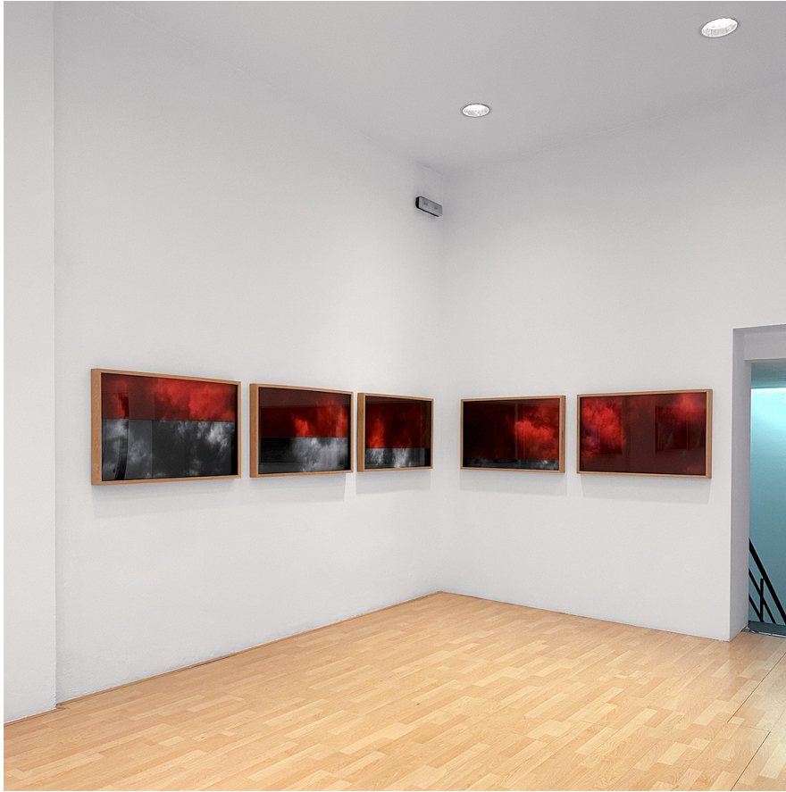
Vista de «Me voy con las flores».

Cada nimbo cuestiona la fugacidad del pensamiento, la autenticidad del instante, la promesa de un significado que siempre logra evadirse. El artista demuestra que la poesía no se halla en el aspecto o en la materia, sino en la experiencia. Contemplar sus horizontes es aceptar los riesgos de la impermanencia y reconocer que vivir consiste en conservar el interés, a pesar de que la tormenta amenace con borrar todo contorno.