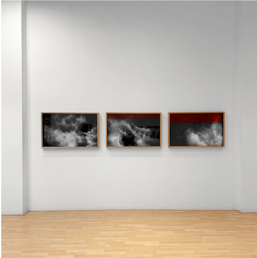
Vista de «Me voy con las flores».