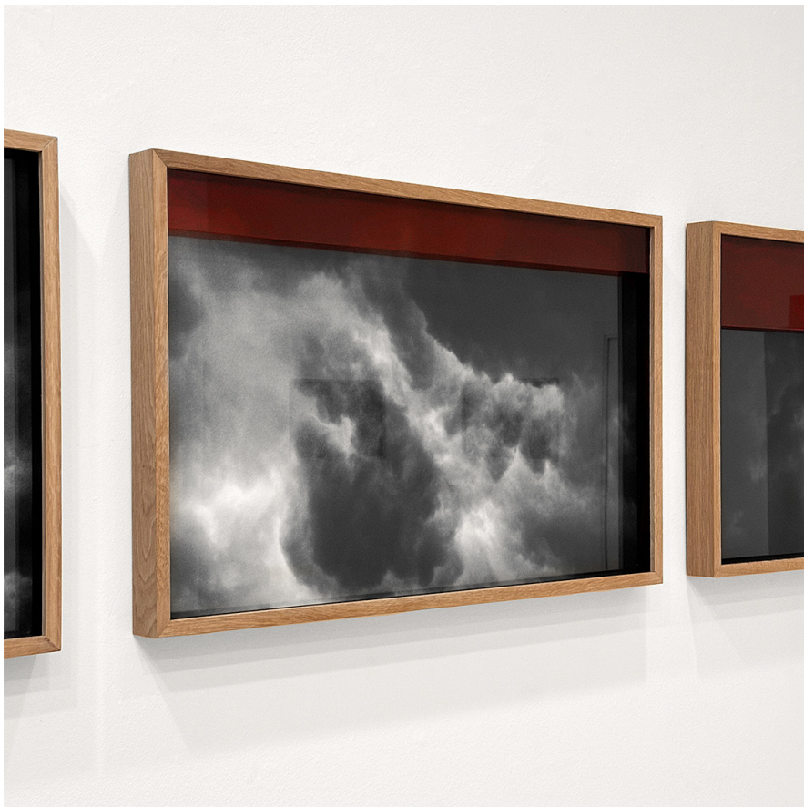
Vista de «Me voy con las flores».