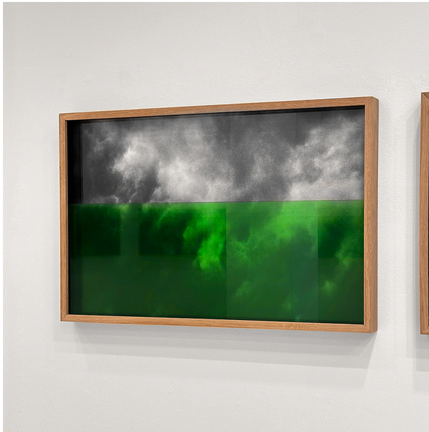
Vista de «Me voy con las algas».