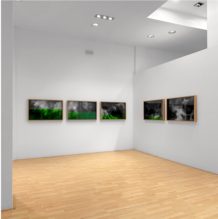
Vista de «Me voy con las algas».