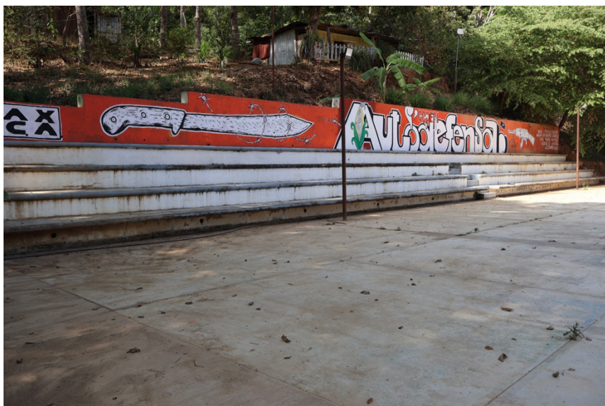
Mural de gradas de foro.

Tras una larga gestión posterior a la toma, consiguieron que se otorgaran los documentos para su ocupación permanente. Se quedaron con la mitad de las 600 hectáreas que componen el terreno. La otra parte se devolvió a los dueños que no hubieran podido recuperar su tierra sin ayuda del Comité, porque no pagaron ni al banco ni a los trabajadores su deuda.