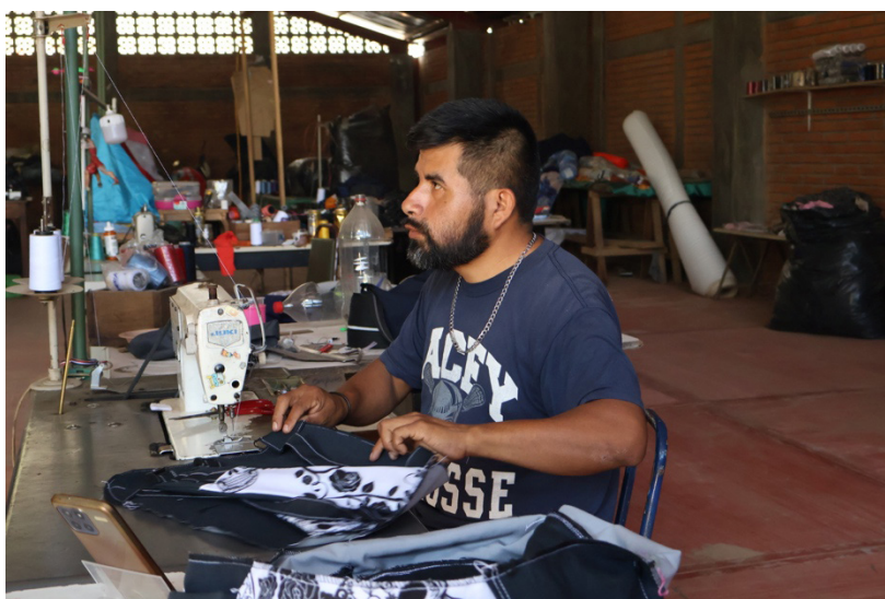
Deconstrucción del género.