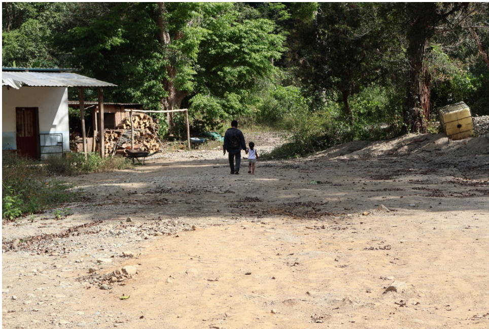
Por-venir en el Centro de Capacitación CODEDI. Imagen Pavel Scarubi, 2025.