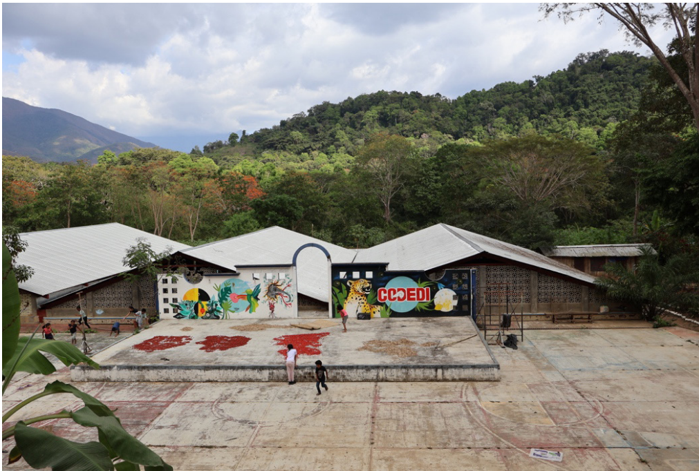
Centro de Capacitación CODEDI en la Finca Alemania. Imagen Pavel Scarubi, 2025.

En el sureste mexicano, particularmente en algunas regiones altas de Chiapas y Oaxaca, existe una variedad nativa de maíz llamada Olotón. La singularidad de esta especie es su capacidad de supervivencia en suelos muy pobres y sin nutrientes, pues desarrolla raíces aéreas que secretan un mucílago rico en polisacáridos que permite el crecimiento de una comunidad de microorganismos de bacterias y diazótrofos. Así, se genera un mutualismo para tomar el nitrógeno del aire y convertirlo en amonio y óxidos que brindan los nutrientes para el crecimiento de la planta y la vida de los microorganismos. La colaboración de pequeñas colectividades permite la sobrevivencia del maíz Olotón y brinda una alimentación sostenible a poblaciones humanas cuyas tierras no son fértiles.