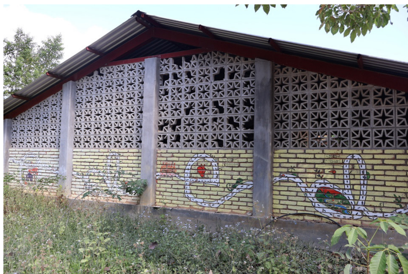
Mural en espacio de capacitación.

El espacio pedagógico que al principio tenía la intención de seguir los lineamientos institucionales supuso un desborde. La pedagogía abrió un campo de experiencia a manera de un laboratorio de vida solidaria, en el que se prueban diferentes formas de compartir los saberes, sin fijar modos absolutos. Lo que rompe con las formas de acceder al conocimiento en estructuras que no toman en cuenta el contexto, como sucede en los planes educativos oficiales.