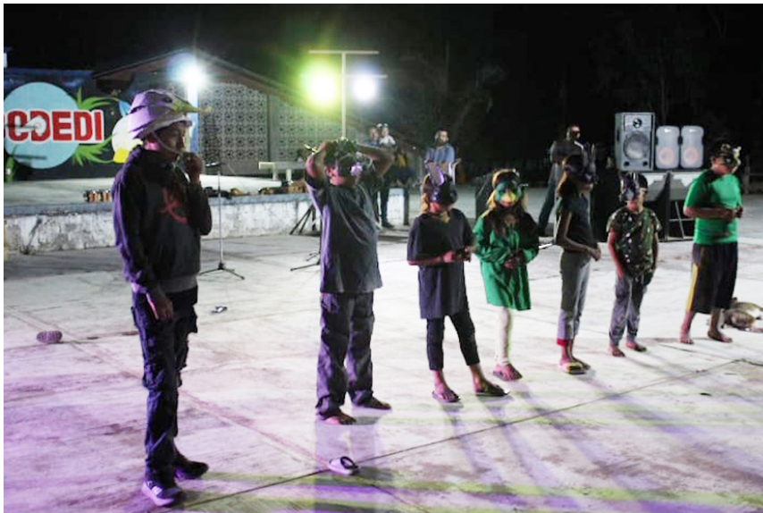
Obra El tratado , 2024. Imagen Luis Ángel Ramírez Cruz.