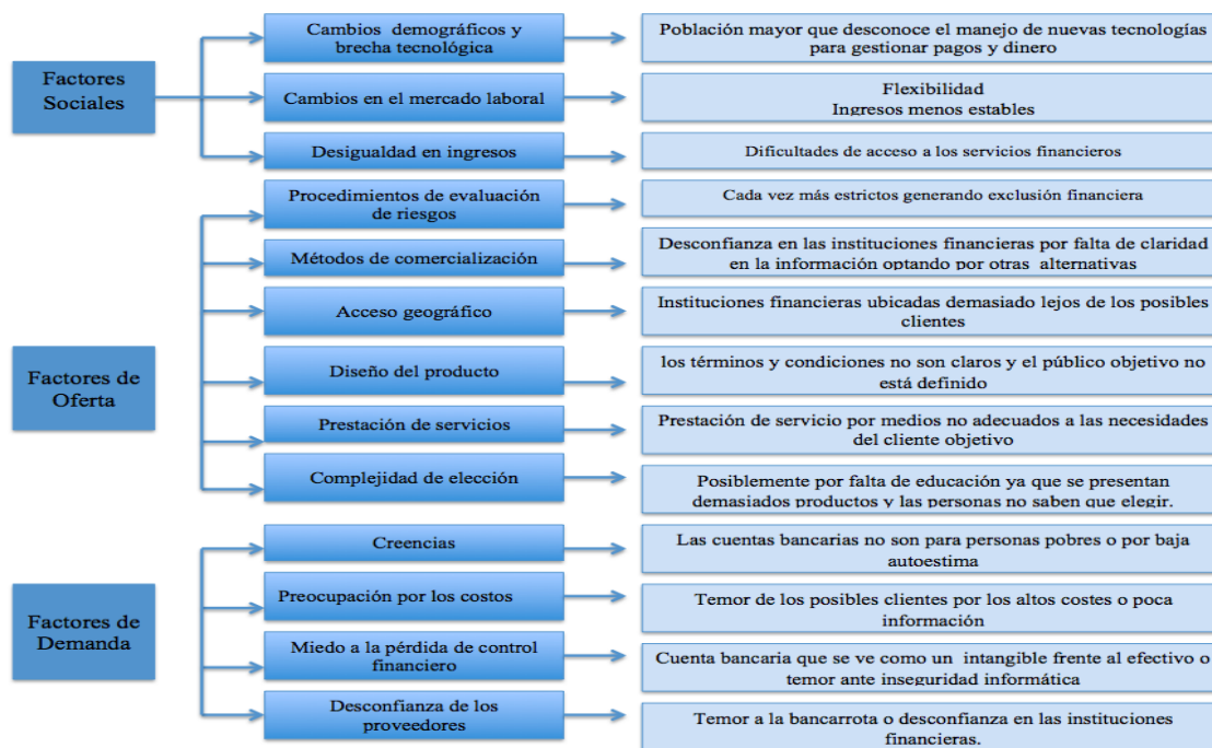
Figura. 2. Factores de acceso o uso que afectan la exclusión financiera