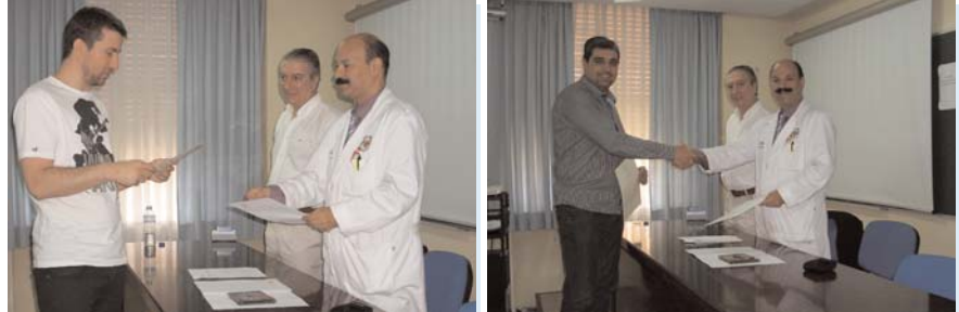
Entrega de Diplomas

destacar en el mundo laboral. La idea de abordar no solo las técnicas más efectivas de la Tanatopraxia actual, sino también aquellos aspectos relacionados con la Sanidad Mortuoria, desde la óptica normativa y reglamentaria y de la gestión, permite ampliar en el futuro el abanico temático con la propuesta de cursos todavía más específicos y técnicos. El horario elegido en jornadas intensivas de viernes y sábado, ha permitido a los asistentes compatibilizar sus tareas profesionales con las formativas, aunque es evidente que siempre existirán alternativas de programación que pudieran interesar a otros colectivos.