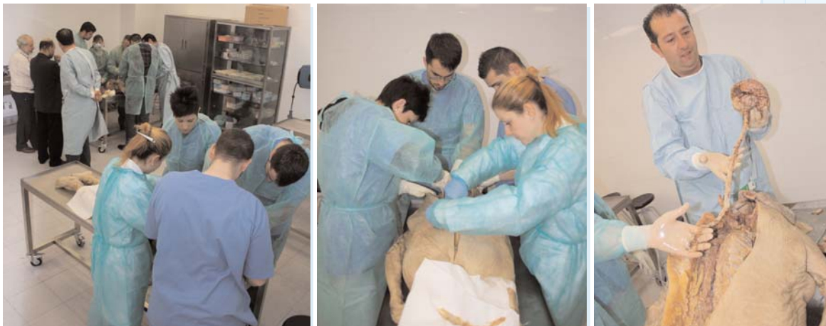
Manos a la obra. A la derecha, Extracción completa de cerebro y médula