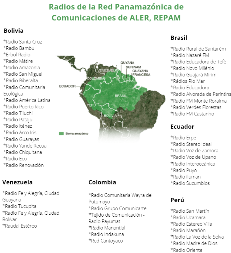
Figura 2. Algunas radios que componen la Red Panamazónica de Comunicaciones de ALER, REPAM