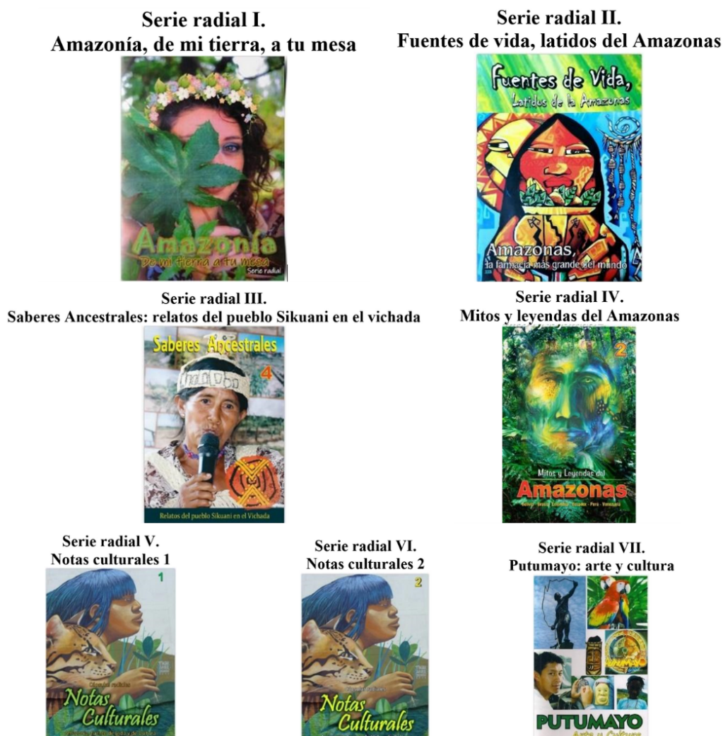
Figura 4. Series radiales del proyecto “En la Onda del Cuidado del Amazonas”

El análisis de contenido realizado da cuenta de una estrategia discursiva en defensa de la Amazonía articulada desde el reconocimiento de la variedad territorial, étnica y cultural de los pueblos indígenas que la habitan. Las peculiaridades de cada territorio, incorporando valores y sentires propios de cada región son exaltadas, promoviendo el rescate de la memoria oral, e incorporando las lenguas y expresiones nativas y de la mitología propia de las comunidades originarias de la región amazónica. De esta manera, el eje central de la narrativa se estructura a partir del reconocimiento de la Amazonía como un bien ancestral de los pueblos originarios, del que surgen todo un entramado de saberes y referentes de la cosmogonía y cultura andina y amazónica que deben ser preservados.