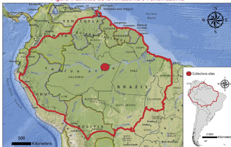
Figura 1. Límites de la Amazonia o Panamazonia

El bioma amazónico abarca nueve países en América del Sur: Venezuela, Colombia, Ecuador, Perú, Brasil, Guyana, Surinam, Guyana Francesa y Bolivia. También se le conoce como Panamazonia, término acuñado por la Organización del Tratado de Cooperación Amazónica (OTCA) en los años setenta como una manera de resaltar su existencia en diversos territorios de la región y con el fin de aumentar su preservación y regular la explotación de los recursos naturales en la zona (Instituto Amazónico de Investigaciones Científicas Sinchi, 2024).