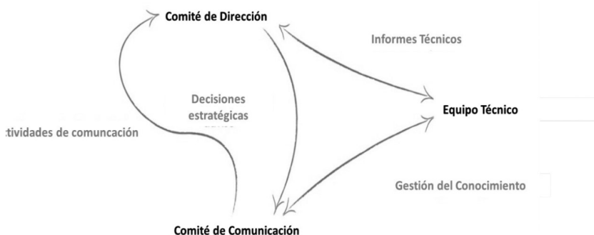
Figura 2. Relaciones entre los distintos comités de la Alianza