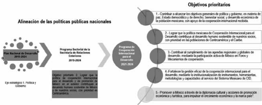
Figura 2. Alineación Estratégica PROCID 2021-2024 3 .

Esta política denominada “Especial” 2 , se coloca de manera transversal al resto de las políticas públicas de México plasmadas en los programas sectoriales de las dependencias y entidades de la Administración Pública federal (APF). Ello refiere una visión integradora, donde todos los sectores de la APF de manera coordinada, y atendiendo también sus prioridades sectoriales, contribuyen a la cooperación internacional en ambos sentidos; para beneficio propio o del de terceros países.