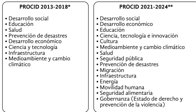
Figura 4. Prioridades temáticas de la política de CID y su evolución

* PROCID 2014-2018 contempla un Gobierno cercano y moderno, democratizar la productividad y perspectiva de género como ejes transversales.