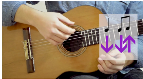
Figura 2. Captura de pantalla videotutorial: rasgueo con transparencia.