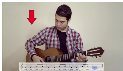
Figura 3. Captura de pantalla videotutorial: partitura con marcadores móviles.