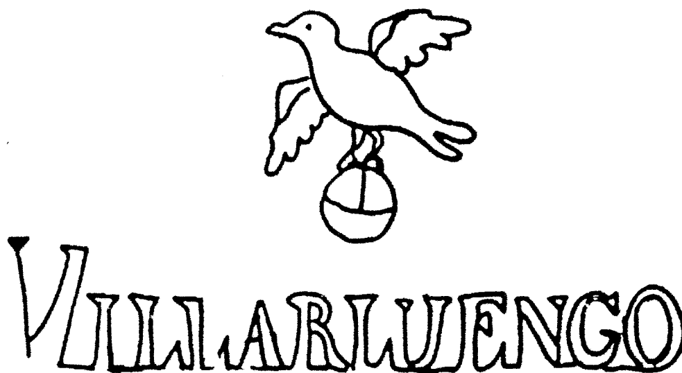
Figura 2. Filigrana del papel de guarda de la Materia medicinal .

sus características. Sin embargo, se podría sospechar que la relación de parentesco que existe entre una y otra, al margen de ser una copia, pueda deberse a una tercera posibilidad: que la Materia medicinal y los Qvatro libros sean ambas copia de otra obra.