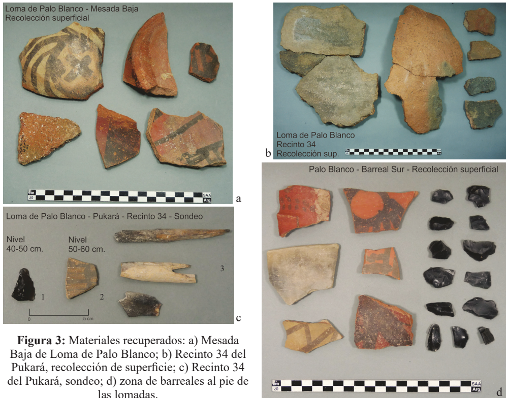
Figura 3: Materiales recuperados: a) Mesada Baja de Loma de Palo Blanco; b) Recinto 34 del Pukará, recolección de superficie; c) Recinto 34 del Pukará, sondeo; d) zona de barreales al pie de las lomadas.

sada Baja, las estructuras se encuentran mayormente aisladas, pero existen algunos casos de recintos pequeños con pasillos que comunican con espacios construidos más grandes. Sobre la ladera de acceso a este sector desde la Mesada Baja se encuentra una muralla de 470 m de largo que bordea los lados sur y oeste, para finalmente cerrar el asentamiento en el extremo norte del Pukará. En un trabajo anterior (Wynveldt et al. 2013) pusimos en duda el carácter defensivo de esta muralla, dado que no presenta una altura considerable. Sin embargo, sobre la misma ladera que une el Pukará a la Mesada Baja se encuentran otros tres muros cortos a diferentes cotas que pueden interpretarse como los cimientos de antiguas estructuras defensivas. Todas estas construcciones probablemente tuvieron mayor altura y debieron derrumbarse con el tiempo; además pudieron estar en parte construidas con materiales perecederos (adobe, vegetación espinosa) como complemento, y funcionar como barreras para el acceso. Por otra parte, desde el Pukará se obtiene un amplio campo visual, que permite el control del entorno inmediato, además de una intervisibilidad con varios poblados tardíos de la región (Wynveldt et al. 2013).