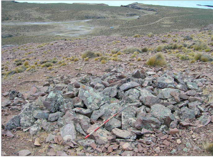
Figura 6: Vista hacia el norte de la estructura II-BP-2. Al fondo se observa la costa de la playa Barco Hundido.

PAM) y Peñón Azopardo Oeste (PA-PAW). Las dos últimas se ubican en las cotas más elevadas de Punta Azopardo.