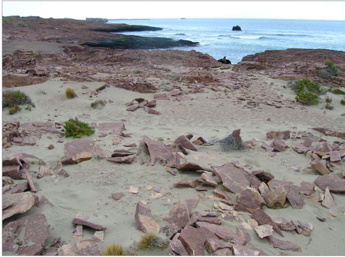
Figura 4: Vista de las estructuras PNS-PCW-5 y 6.

En las cercanías de Playa Castillo, en el sector más elevado (aproximadamente a 30 msnm), se encuentra la estructura aislada Punta Norte Sur 2 (PNS-2) y dos estructuras contiguas denominadas Cima Castillo (PNS-CC) (ver Figura 3). En la primera se registró una gran cantidad de restos humanos muy meteorizados expuestos en superficie (Figura 5), tanto en su interior como en las cercanías, probablemente debido a la acción de saqueo. En Cima Castillo, además de gran cantidad de restos humanos, se observó en asociación material cerámico (19 tuestos de tamaño chico; Trola y Ciampagna 2011) y lítico (instrumentos de diversas materias primas: raspadores, raederas, puntas destacadas, perforador, puntas de proyectil fracturadas; ver Cuadro 3). Es importante resaltar este hecho ya que en estas acumulaciones de piedras y en otra localizada en Punta Azopardo (ver más adelante), han sido las únicas donde se encontraron restos arqueológicos asociados en superficie lo que representa los primeros casos registrados no sólo para esta área, sino para toda la CNSC.