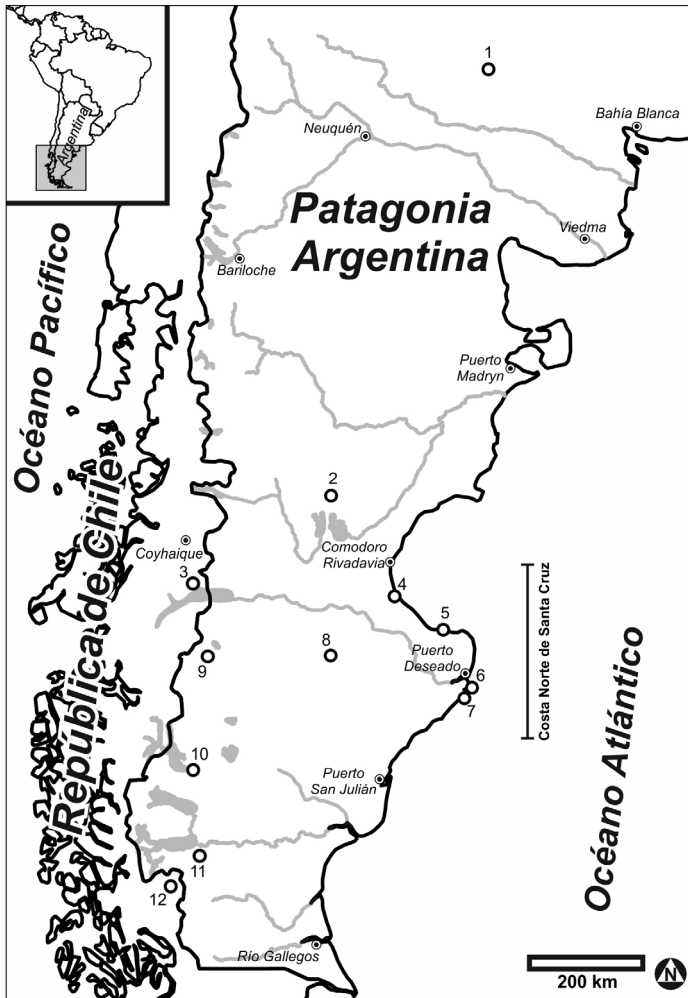
Figura 1: Mapa de la Patagonia con la ubicación de los sitios y localidades mencionadas en el texto, así como las principales ciudades. Referencias: 1) Chenque I; 2) Cerro Yanquenao; 3) Puerto Ingeniero Ibáñez; 4) Sitio Heupel; 5) Cañadón del Duraznillo; 6) Bahía del Oso Marino; 7) Campo de Chencques; 8) El Sargento; 9) Lago Salitroso; 10) Cerro Cach Aike; 11) Cerro Huyliche 1; y 12) Cerro Guido.

CNSC). En este sector fue posible reconocer una serie de estructuras que, por comparación con otras de similares características presentes en la CNSC y en otras regiones de Pampa-Patagonia, podrían ser consideradas como estructuras de entierros, denominados genéricamente chenques.