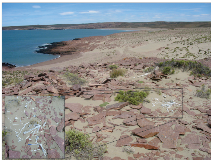
Figura 5: Vista de la Estructura PNS-2. En la parte derecha de la imagen y en el recuadro de la izquierda (detalle) se observan restos óseos humanos muy meteorizados.

tanto en inminente riesgo de destrucción por diversos agentes, por lo que se decidió realizar un rescate y tomar una pequeña muestra para la realización de fechados (Cuadro 4). Ambas estructuras se hallaban aproximadamente a 160 m de distancia entre sí. Una de ellas forma parte de la concentración denominada Playa Castillo (Zilio et al. 2013); la otra corresponde a la estructura aislada Punta Norte Sur 2. Las dos dataciones arrojaron una cronología de 730 \pm 60 años AP (LP-2523) y 770 \pm 60 años AP (LP-2558), respectivamente. Estos resultados son muy similares, lo que podría indicar una contemporaneidad entre las mismas (Zilio y Hammond 2013).