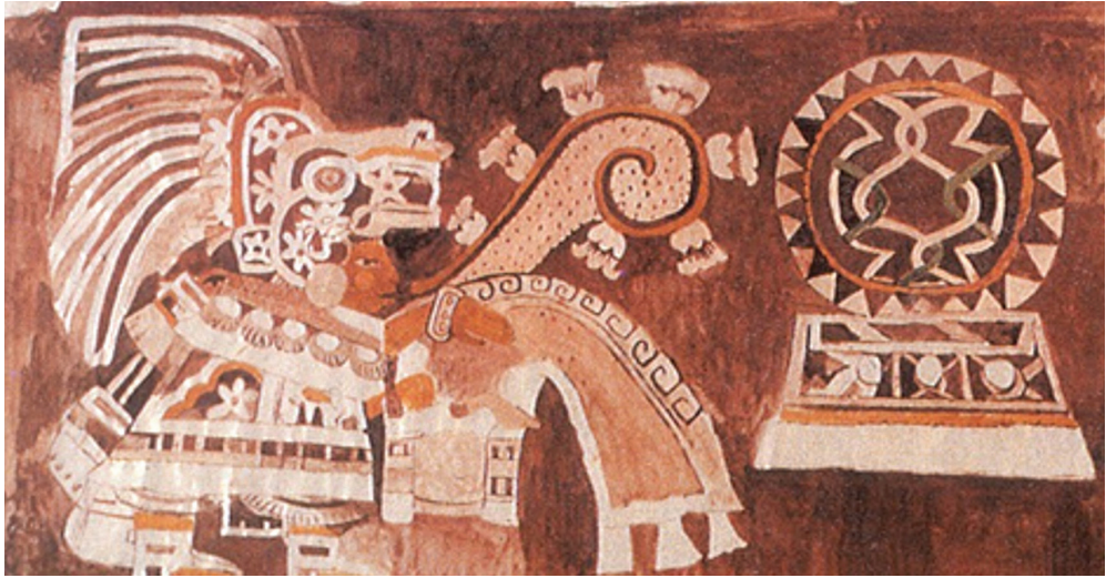
Figura 3: Pintura mural del sitio de Teopancazco en la cual se muestra a un sacerdote en un acto de procesión, junto a un altar (derecha) con una vestimenta que incluye elementos alusivos al mar tales como estrellas y conchas (Manzanilla et al. 2009); el acto incluye oraciones (vírgrula que sale de la boca) mientras arroja semillas con la mano derecha, indicando así la relación entre los contextos agrícola y marino.

parte del mismo incluye elementos como ondas de agua, estrellas, muy probablemente de mar, y conchas marinas (Manzanilla et al. 2009).