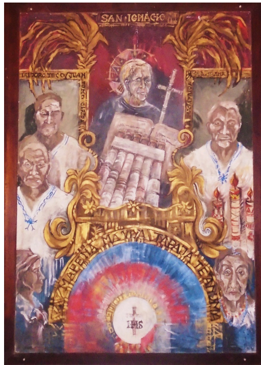
Figura 1. Pintura de los primeros caciques y mamas, del cabildo indigenal de San Ignacio de Moxos 31 .