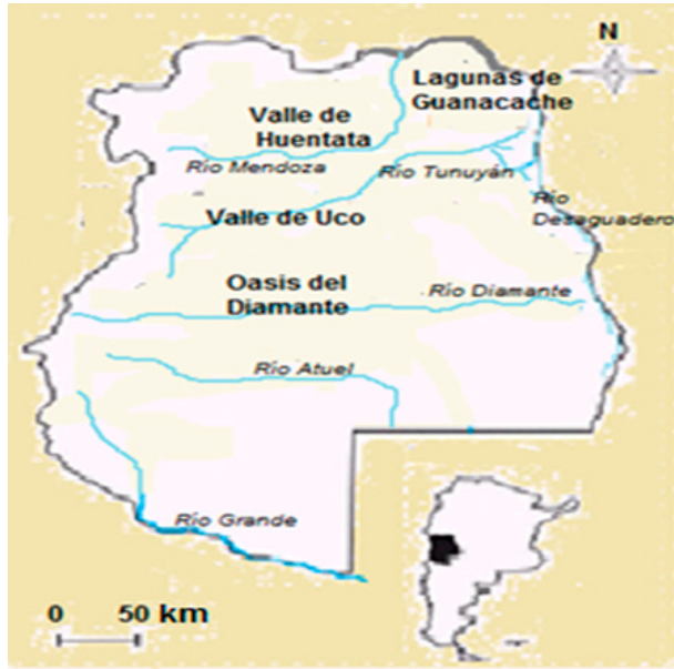
Figura 1. Ríos principales y zonas irrigadas de Mendoza a fines del siglo XVIII. Elaboración propia.