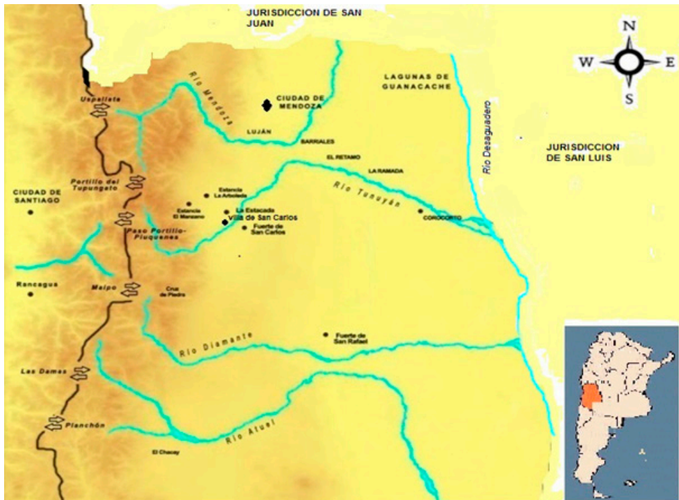
Figura 2. Pasos cordilleranos y puntos claves en el proceso de equipamiento político del territorio, 1800-1850. Elaboración propia.