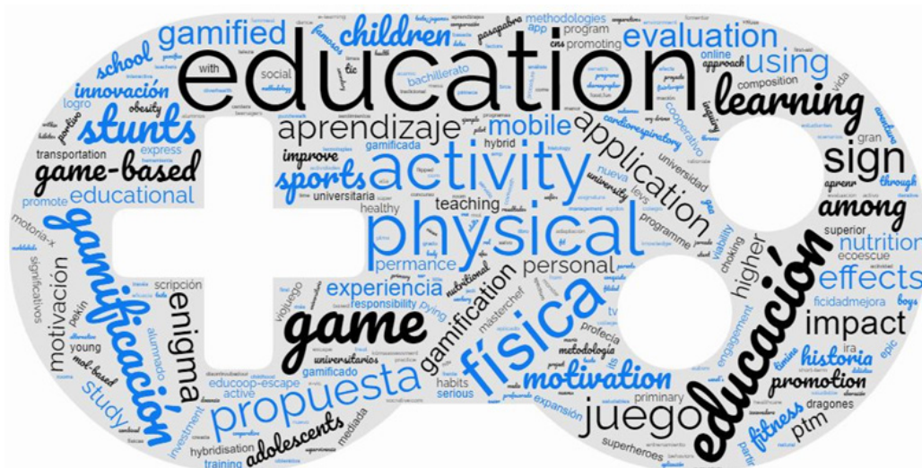
Figura 2. Palabras clave más frecuentes utilizadas en los artículos sobre propuestas didácticas en gamificación