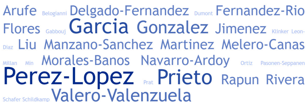
Figura 3. Autores/as más frecuentes en las publicaciones

Respecto a la producción científica, en la tabla 3 se pueden observar los artículos y comunicaciones agrupados según las diferentes categorías que se han determinado en la revisión tras el análisis de las contribuciones incluidas en el cuerpo base: según la población, la metodología, el soporte, el carácter y el tipo de juego implementado.