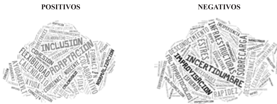
Figura 1. Nubes de palabras sobre los aspectos mencionados por el profesorado. Elaboración propia.

En la figura 1 se muestran dos nubes de palabras, a modo de resumen, de las principales afirmaciones realizadas por el profesorado en relación a la situación que se está produciendo, dividido, por un lado, en los aspectos positivos mencionados y, por otro, los negativos.