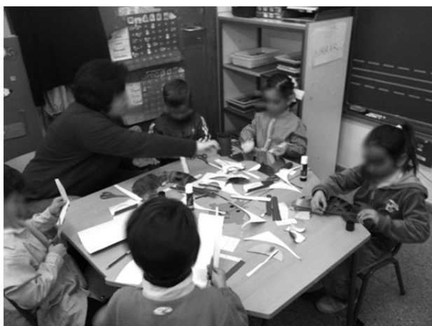
Figura 2. En la fotografía se muestra a una mamá ayudando a los discentes a realizar collares para el disfraz de faraones y faraonas. (V.5.1.3.)

"Elaboración del disfraz de faraones. Por un lado, unas mamás se encargan de hacer el disfraz con bolsas de basura blancas y por otro, otras se distribuyen entre las manchitas para ayudar a los niños y niñas a elaborar los collares para el disfraz". (R.5.1.3.)