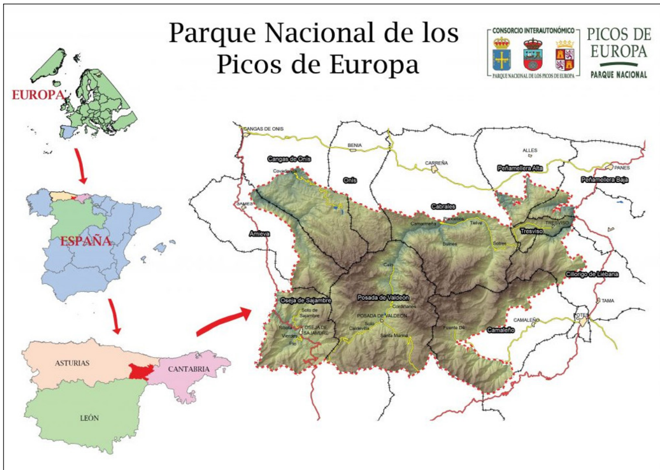
Imagen 1. Situación del PNPE