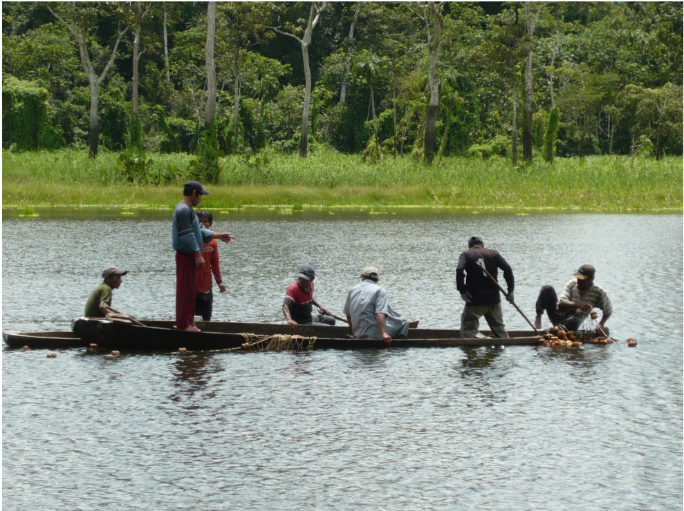
Fig. 2. Integrantes del grupo Tigres Negros pescando paiche (Arapaima gigas) en la laguna Jacinto.