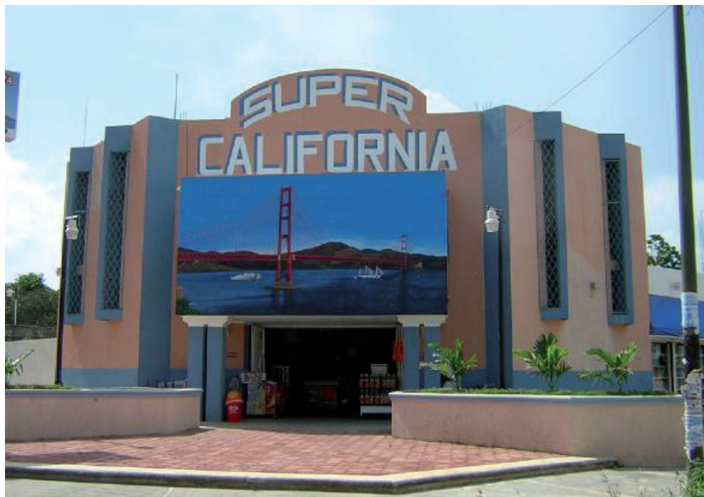
Figura 5. Super-Bodega Oxcutzcab, Yucatán