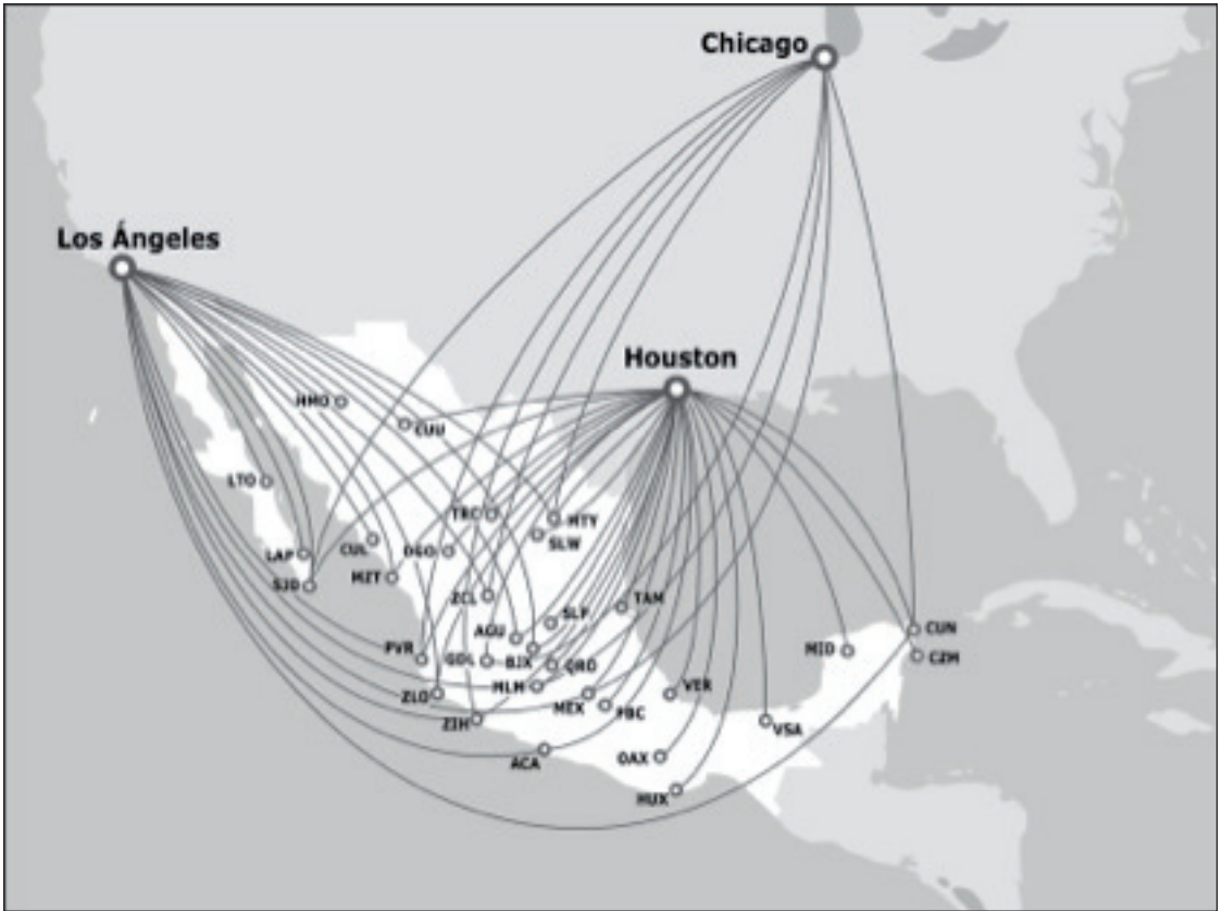
Figura 3. Direccionalidad de las conexiones hacia México desde Houston, Los Ángeles y Chicago, tres las zonas metropolitanas de Estados Unidos que cuentan con mayor número de residentes nacidos en México.

precedentes. En este sentido, la vecindad de un aeropuerto se ha convertido en un factor que no solo facilita las migraciones sino que las potencia psicológicamente en relación con la idea de la “vecindad sensorial”, ya aludida en este trabajo.