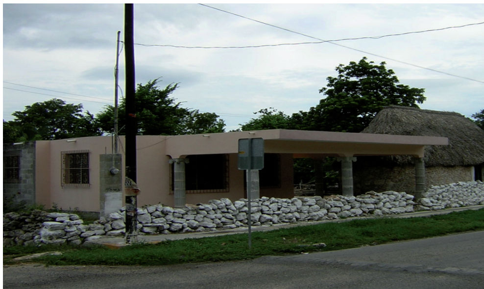
Figura 4. Un solar familiar donde conviven casa de adobe y casa de cemento