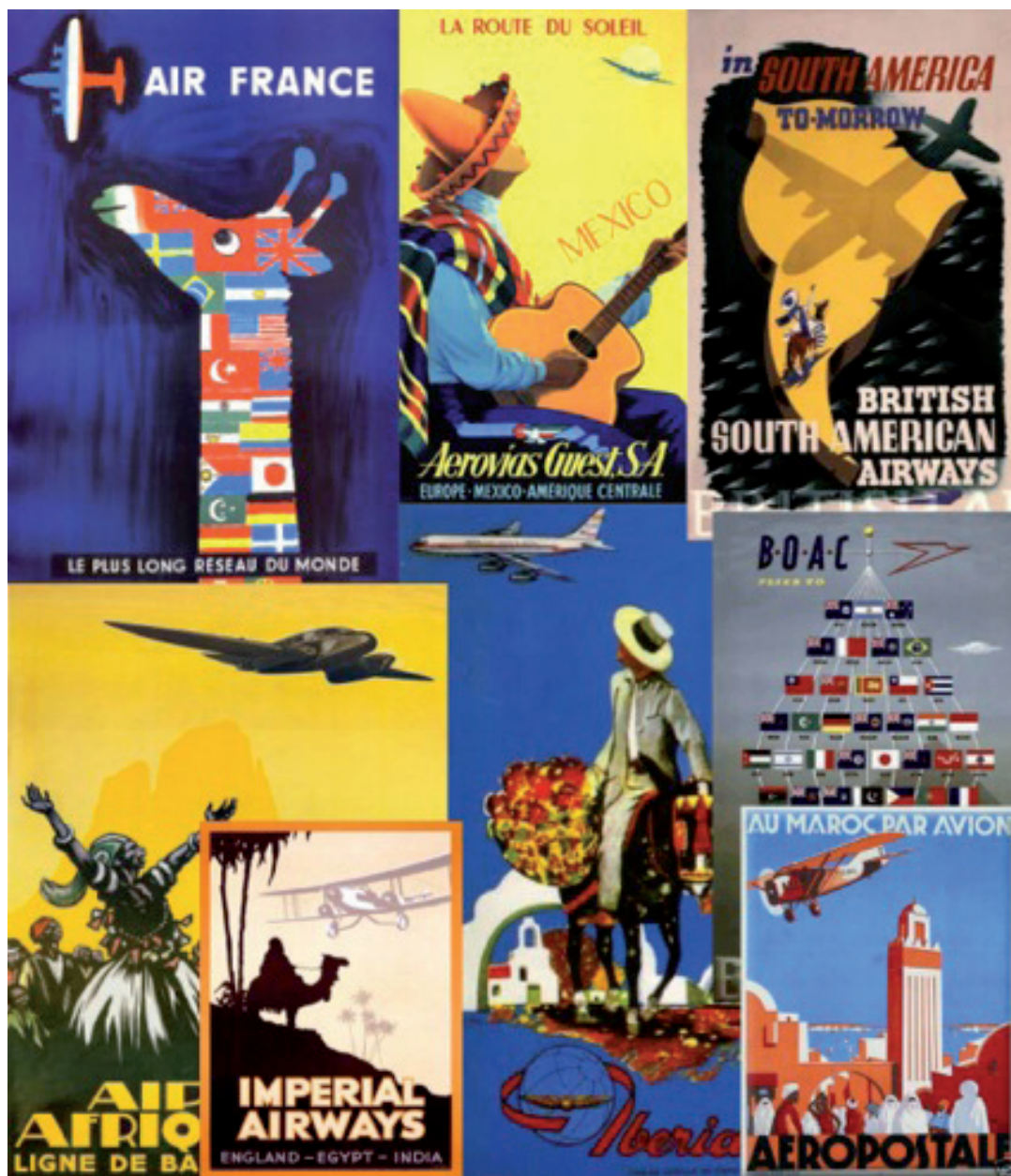
Figura 1. El cartelismo publicitario de las empresas de transporte aéreo documenta el recurso a los tópicos de la internacionalidad y del encuentro entre tradición y modernidad como reclamo. Carteles publicitarios de diferentes empresas de transporte aéreo entre los años 40 y los años 60 del siglo pasado.