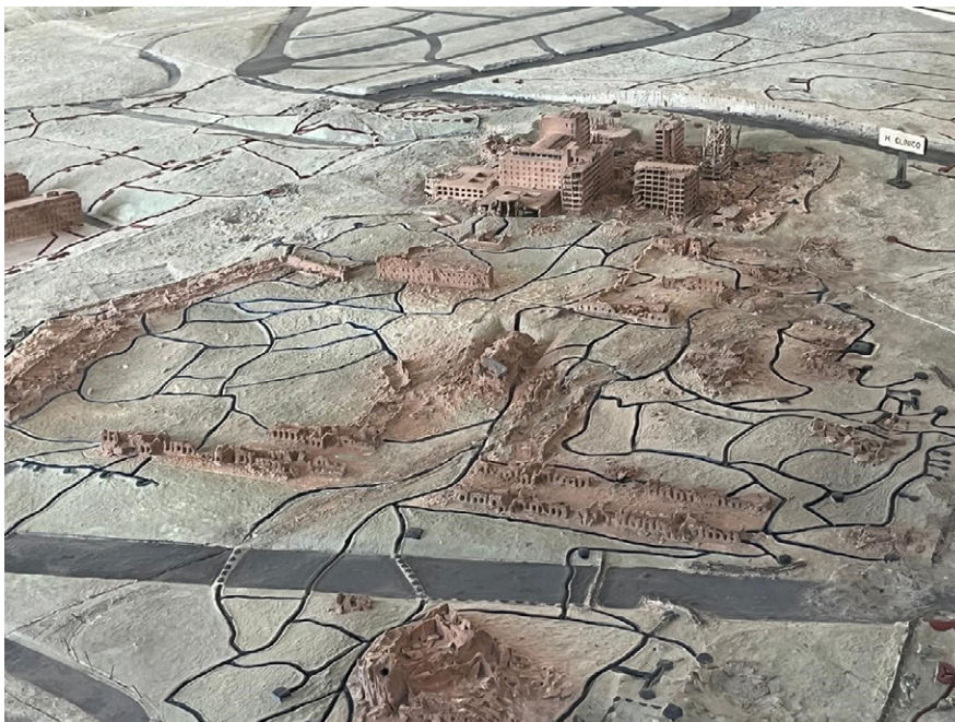
Fig. 3. Narrativas de la ruina. "Maqueta de la Ciudad Universitaria de Madrid, al final de la guerra", ca. 1943. Ángel Ordóñez Tuero. Escayola y pigmento. Museo del Ejército. Ministerio de Defensa. (ME[CE] N° 26267. Maqueta de la Ciudad Universitaria de Madrid. Museo del Ejército).

Hablan, escriben, sentencian, evidencian, denuncian, recuerdan, homenajean. ¿De qué manera las ruinas, en la guerra de España y en sus años posteriores fueron imaginadas, interpeladas, interpretadas? El gesto de contraponer a la victoria y al tiempo nuevo que inauguran la destrucción y la ruina como gesto de conexión con el pasado, hace parte de una puesta en escena de dos visiones de mundo confrontadas. Un gesto que, a distintas escalas, desde las políticas del cuerpo a los planes urbanos, impulsaría el franquismo durante más de 50 años.