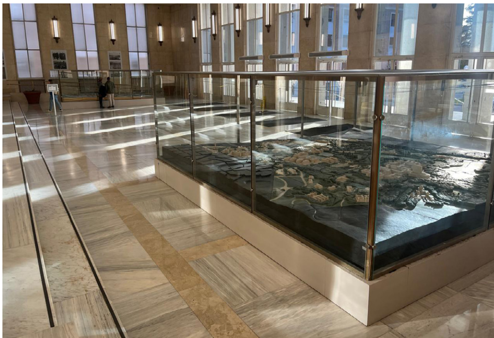
Fig. 2. Sueños del orden franquista en la Ciudad Universitaria. Maqueta de la Ciudad Universitaria de Madrid con los planes de la reconstrucción. 1943. Patrimonio Histórico de la Universidad Complutense de Madrid. Foto del autor, 2024.

La maqueta presenta, en efecto, el plan para la reconstrucción de la Ciudad Universitaria tal y como fue concebido a inicios de la década de 1940. La pieza se presentó en el Pabellón de Gobierno de la Universidad el 12 de octubre de 1943 con motivo de la inauguración de los edificios reconstruidos después de la Guerra Civil con la presencia del generalísimo y de las máximas autoridades ministeriales.