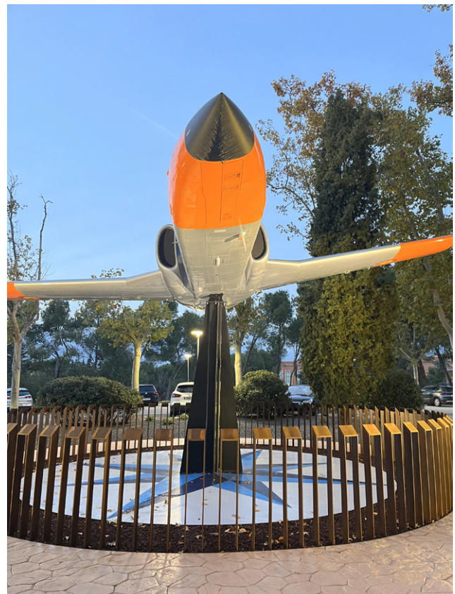
Fig. 6. Homenaje a las Fuerzas aéreas.

En noviembre de 2024 fue inaugurado este espacio monumental en torno al avión C-101, cedido por el Ejército del Aire y del Espacio al frente de la Escuela Técnica Superior de Ingeniería Aeronáutica y del Espacio (ETSIAE) de la Universidad Politécnica de Madrid (UPM) en un acto presidido por el jefe del Estado Mayor del Ejército del Aire y del Espacio y el rector de la Universidad Politécnica de Madrid.