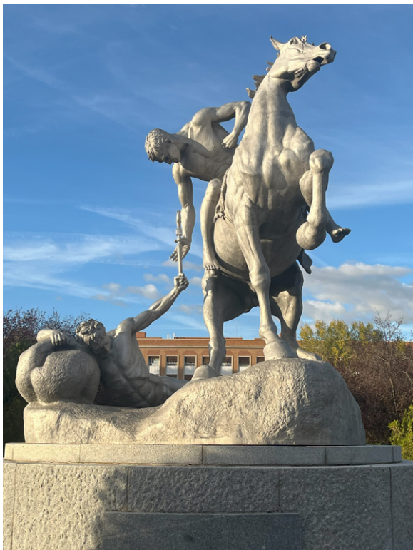
Fig. 5. Monumento “Los portadores de la antorcha” de Anna Huntington. Ciudad Universitaria de Madrid.

En la Ciudad Universitaria el tropo castrense se extiende hasta el presente y aparece reactualizado en el avión C-101 convertido en “monumento” recientemente emplazado al frente de la fachada principal del Instituto Aéreo. El monumento representa una memoria incómoda en una ciudad en la que los ataques aéreos como estrategia de guerra constituyen un oscuro antecedente. El “monumento” evoca también las versiones más recientes del vínculo gubernamental con los gobiernos autoritarios latinoamericanos al que Franco le daría durante su gobierno un notable impulso con numerosas visitas protocolarias 3 .