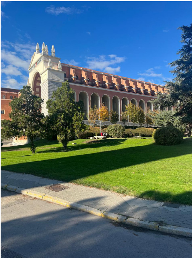
Fig. 7. Museo de América, 2024. Fotografía del autor

Las colecciones del museo reproducen, de manera acrítica, narrativas como la crueldad inhumana de los aztecas, la admiración granjeada por Pizarro entre los indígenas del Cuzco, la monstruosidad de los cuerpos de los naturales o los ordenamientos jerárquicos a partir de regímenes racializados de la sociedad colonial. Asimismo, como en el Cabinet de curiosités característico de las exposiciones universales, en una sola vitrina se reúnen los arpones de los guajiros, las lanzas de los chilenos, los anzuelos de los brasileños. Una comunidad de semejantes