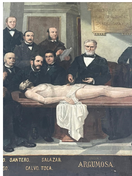
Fig. 4. Diego de Argumosa, Antonio Bravo, 1885. Fotografía del autor

Dos largas trayectorias confluyen aquí. La primera, aquella en la que los atlas de geografía y de anatomía, “se alimentaron mutuamente a lo largo de la Edad Moderna” al ser ambos “saberes descriptivos, espaciales, orientados hacia la localización y la interrelación entre las partes” (Sáenz-López Pérez y Pimentel, 2017: 189). La segunda, aquella que en España se remonta, al menos hasta mediados del siglo XVIII, cuando situándose a medio camino entre el coleccionismo y la pedagogía, museos y academias impulsaron amplios programas de producción de maquetas y reproducción de monumentos”, jugando un papel de relevancia “en la construcción de una identidad nacional” (MODARCH, 2024). Puestos en relación entre sí y con su entorno, estos objetos dan cuenta de sentidos más amplios que la mera representación. En la siguiente parte analizaré algunas de las operaciones y prácticas espaciales que se produjeron a partir de los usos e imaginaciones en torno a la ruina por parte del franquismo.