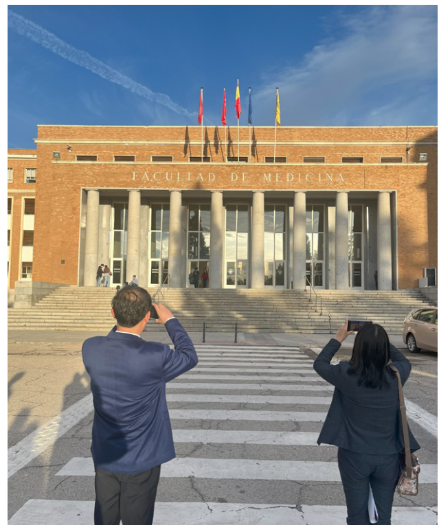
Fig. 1. Facultad de Medicina, Universidad Complutense de Madrid. Noviembre de 2024.

Siguiendo los métodos referidos, rondaremos en torno a diferentes objetos cuya selección y orden no son azarosos y responden a la necesidad de montaje en un dispositivo narrativo que se construye en busca de la problematización misma. Como intentaré demostrar, la práctica de las constelaciones es un trabajo especulativo y subjetivo que permite poner en relación unidades aparentemente disímiles, identificando aquello que los une y articula. Pretendo contribuir a los debates actuales acerca de las maneras en que estamos haciendo memoria del autoritarismo y para ello, propongo un camino en un territorio reconocido como laboratorio de experimentación. Presento entonces a continuación discusiones en torno a problemas que van emergiendo a medida que invito al lector a deambular por esa Tierra de Nadie y la Ciudad Universitaria, postulando que este trabajo contribuye a destacar el potencial pedagógico y político de los lugares conectados en el trabajo de la memoria.