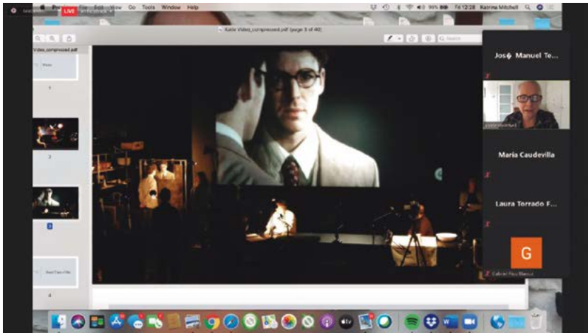
Ponencia de clausura de la directora de escena Katie Mitchell. 24 de octubre de 2020.