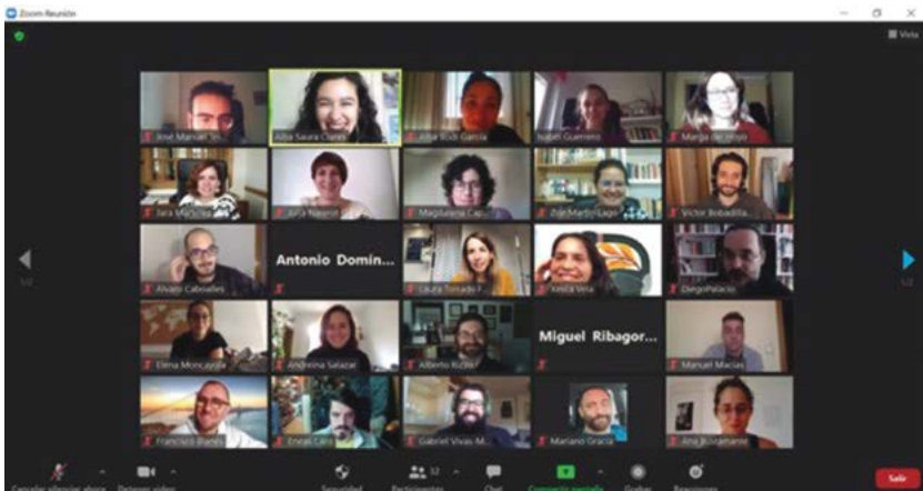
Captura de pantalla de la asamblea de la Asociación de Jóvenes Investigadores en Estudios Teatrales. 24 de octubre de 2020.