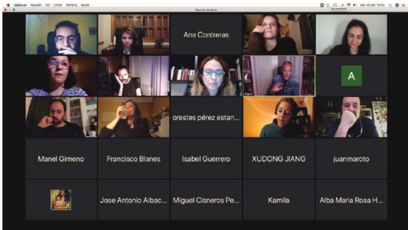
Algunos de los asistentes al encuentro de directores de escena y dramaturgos. 20 de octubre de 2020.