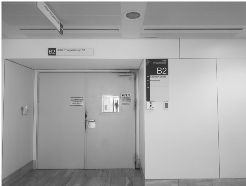
Puerta de entrada a la unidad de hospitalización del área de psiquiatría.