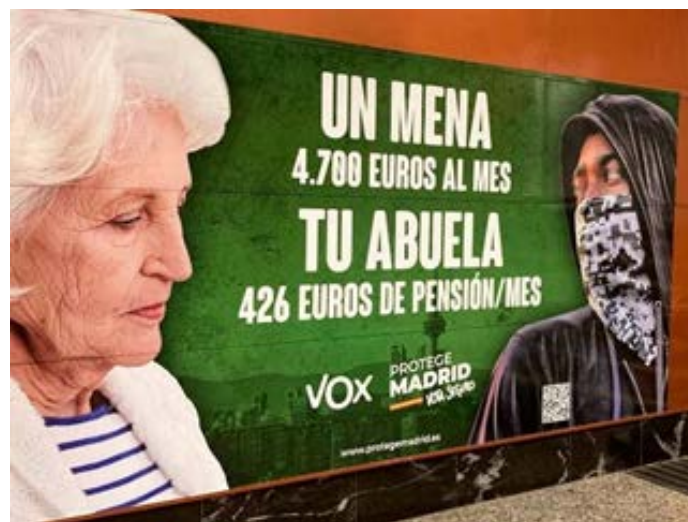
Imagen 1. Cartel de VOX sobre Menores Extranjeros No Acompañados, en la campaña de Madrid 2021.

Este formato de interpelación desde una dimensión personal puede también observarse en la propaganda contra la inmigración irregular durante la campaña para la presidencia de la Comunidad de Madrid en 2021. Como toda la bibliografía existente subraya, el rechazo frontal al ingreso de personas emigradas de sus países de origen, especialmente si estos últimos pertenecen al norte africano, es uno de los aspectos más relevantes del mensaje público de Vox. Tanto en las entrevistas realizadas, como en la producción audiovisual partidaria y la documentación de campaña, se subraya que Vox no se opone a la inmigración en sí, sino a la inmigración irregular, que avalaría la llegada a España de extranjeros delincuentes. Esta cuestión fue enfatizada por los portavoces partidarios de Vox en dos aspectos puntuales: los delitos sexuales cometidos por inmigrantes y la llegada en cantidad de menores extranjeros no acompañados por sus familiares o tutores, llamados por el acrónimo “menas”. 7