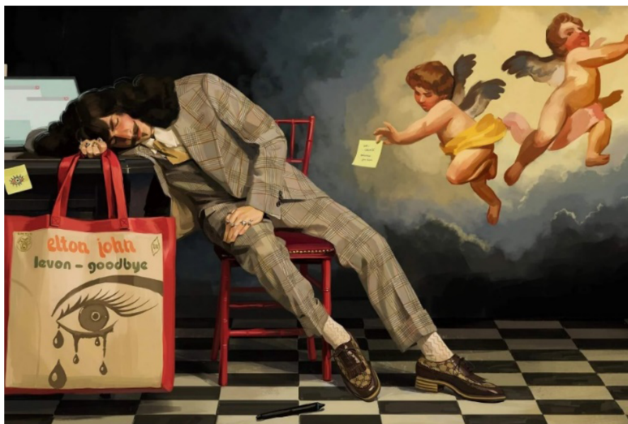
Fig. 10. Ignasi Monreal, Recreación de La Anunciación de Philippe de Champaigne (2018)