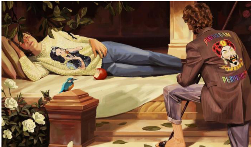
Fig. 14. Ignasi Monreal, Recreación de La Bella Durmiente de Edward Frederick Brewtnall (2018)

Existen otras imágenes de esta campaña que también presentan otro tipo de referencias artísticas, como aquella en la que aparece una recreación de la Basílica de San Pedro (Ciudad del Vaticano), que asoma entre un mar de nubes (Fig. 15). Además, aunque no inspiradas en obras concretas, hay muchas referencias al surrealismo en las que el artista da rienda suelta a su imaginación y crea universos de fantasía irracionales. Se representan animales, especialmente pájaros, en tamaños irreales, o se emplea la técnica de cadáver exquisito, a través de la cual el artista dibuja y combina diferentes partes del cuerpo de varias figuras, creando una imagen final que procede directamente del subconsciente.