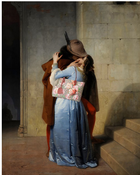
Fig. 1. Ignasi Monreal y Copy Lab. Recreación de El Beso de Francesco Hayez (2015)

Si nos referimos a la imagen de Gucci creada por Ignasi Monreal (Fig. 1), junto con el artista digital Copy Lab (@copylab), se observa la intención de recrear un cuadro que en Italia significó tanto en su momento y que sirvió como un soplo de esperanza. El porqué de introducir un bolso en vez de cambiar los colores de la ropa resulta evidente: los colores azul, verde, blanco y rojo de la vestimenta deben seguir siendo protagonistas para que la intención principal de la obra original no se pierda.