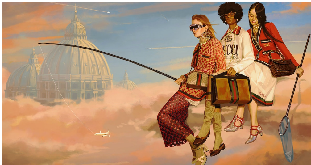
Fig. 15. Ignasi Monreal, Recreación de la Basílica de San Pedro, Ciudad del Vaticano (2018)

Existen otras imágenes de esta campaña que también presentan otro tipo de referencias artísticas, como aquella en la que aparece una recreación de la Basílica de San Pedro (Ciudad del Vaticano), que asoma entre un mar de nubes (Fig. 15). Además, aunque no inspiradas en obras concretas, hay muchas referencias al surrealismo en las que el artista da rienda suelta a su imaginación y crea universos de fantasía irracionales. Se representan animales, especialmente pájaros, en tamaños irreales, o se emplea la técnica de cadáver exquisito, a través de la cual el artista dibuja y combina diferentes partes del cuerpo de varias figuras, creando una imagen final que procede directamente del subconsciente.