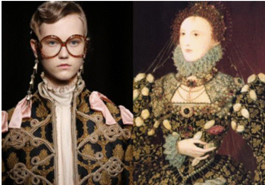
Fig. 4. Comparativa extraída de la página Gucci: a la izquierda, fotografía de pasarela de Gucci (2018); a la derecha, Nicholas Hilliard, El Retrato Fénix (1575)