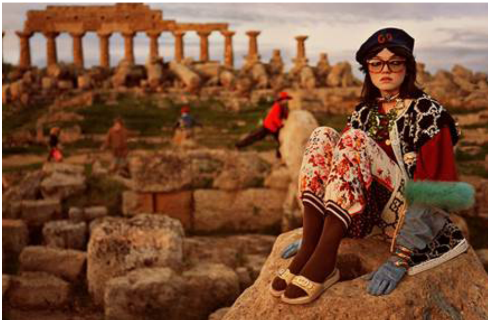
Fig. 16. Imagen de la campaña Preotoño, Gucci (2019)

Para la colección de Preotoño de 2019 hubo otra gran referencia artística en la campaña publicitaria. No se trató de recrear una obra de forma directa, sino de subrayar una localización emblemática: el Templo de Hera, construido hacia el 530 a.C. El escenario en este caso tuvo un papel fundamental (Fig. 16).