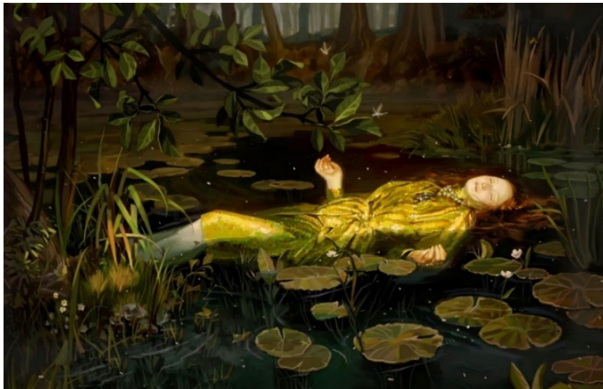
Fig. 12. Ignasi Monreal, Recreación de Ophelia de John Everett Millais (2018)

opuesto, yace de la misma manera sobre el agua: boca arriba y con las palmas de las manos prácticamente abiertas, de una forma muy natural. Solo el rostro presenta una clara diferencia. Millais hace que parezca que la retratada está soltando su último aliento de vida, mientras que Monreal esboza un rostro muy expresivo y natural en la joven, quien se muestra serena. Su traje presenta gran detalle y, en contraste con el agua y con el entorno, brilla, como si desprendiera su propia luz.