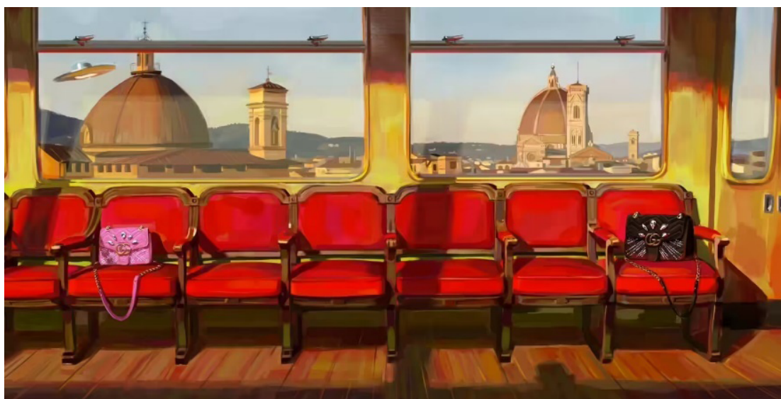
Fig. 6. Ignasi Monreal, Cúpula de Santa María del Fiore (2017)

Todas las imágenes seguirían el mismo estilo en su creación y, una vez más, se recrearían obras conocidas o habría referencias directas a motivos artísticos de ciertas etapas, como la mitología griega y romana, o pinturas medievales y renacentistas. Muchas de las creaciones, como aquella en la que, desde un vagón de tren, se contempla la Cúpula de Santa María del Fiore de la catedral de Florencia, son lugares reales, donde el arte representado adopta la misma importancia que el accesorio publicitado (Fig. 6). Entre las más de 80 ilustraciones que el artista catalán creó para el catálogo, hay algunas que merecen la pena ser analizadas en esta investigación.