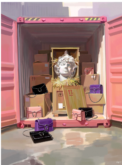
Fig. 8. Ignasi Monreal, Dionysus (2017)