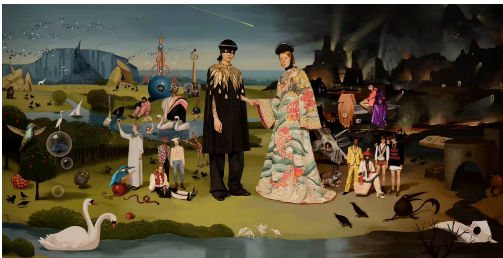
Fig. 9. Ignasi Monreal, Recreación de El Jardín de las Delicias de El Bosco y Retrato de Giovanni Arnolfini y su esposa de Jan Van Eyck (2018)

Una de las grandes ilustraciones de esta campaña es la fusión en una única imagen del Triptico del Jardín de las Delicias (1503-1515) de El Bosco y el Retrato de Giovanni Arnolfini y su esposa (1434) de Jan Van Eyck (Fig. 9). En el centro de la ilustración nos encontramos con la pareja protagonista de la obra de Monreal, que se encuentra posando exactamente igual que el matrimonio Arnolfini: ella al lado derecho y él al izquierdo, y las manos de ambos entrelazadas en el aire entre sus cuerpos.