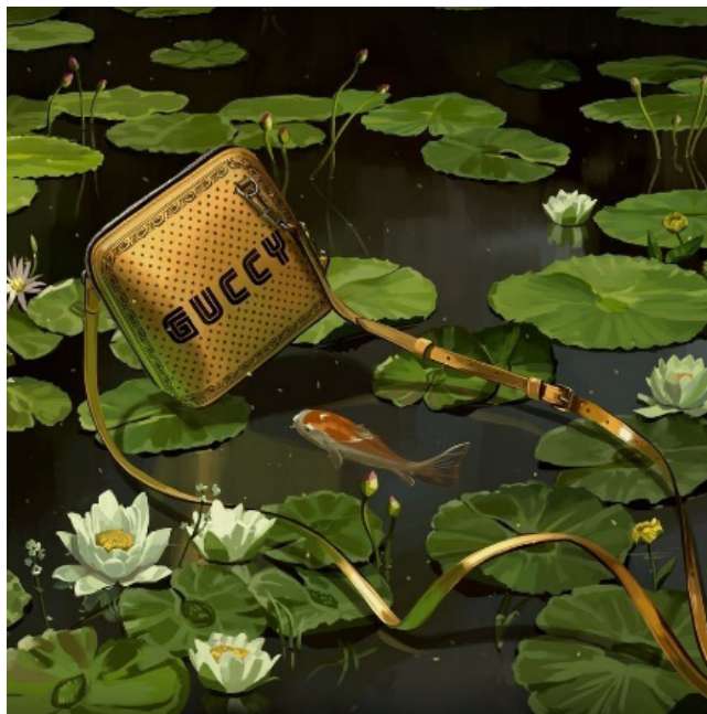
Fig. 13. Ignasi Monreal, Recreación de Convent Thoughts de Charles Allston Collins (2018)

Otras obras prerrafaelitas también son recreadas en esta campaña gráfica. Es el caso de Convent Thoughts (1850-1851), de Charles Allston Collins, cuyo entorno de nenúfares y peces de colores sirve como emplazamiento para uno de los nuevos bolsos de la colección. Así lo explicó la marca a través de su cuenta de Twitter (Gucci, 2018). Se trata de un fragmento muy reducido el que se recrea, pero todos los elementos florales están cuidados hasta el mínimo detalle, como en el original. Destacan las pequeñas flores blancas que se encuentran en el estanque, que revelan la fuente en la que se inspiró Monreal (Fig. 13).