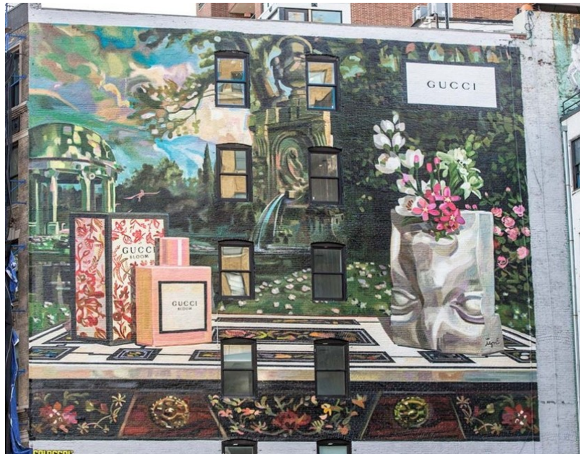
Fig. 5. Gucci Art Wall, Soho de Nueva York (2017)

y la caja correspondiente tienen una presencia importante en primer plano, también destacan las referencias artísticas, como la mesa situada en la parte inferior y que recrea la técnica de piedras duras, popularizada en Florencia durante el Renacimiento. Monreal escogió esta técnica tan particular tras sus múltiples visitas al museo Opificio delle Pietre Dure de Florencia (Gucci, 2017).